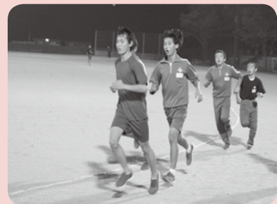
がんばれふくしま駅伝チーム

試合の結果は、 優勝：やまびこAチーム 準優勝：大原Aチーム 3位：大原Bチーム