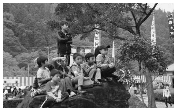
憧れのウルトラマンだ！(10月10日 やぶさめフェア)