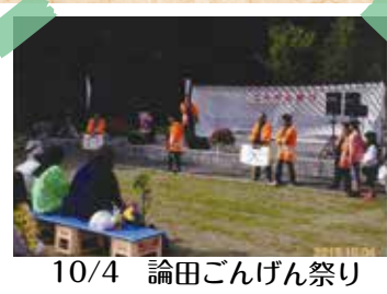
10/4 論田ごんげん祭り