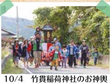
10/4 竹貫稲荷神社のお神輿