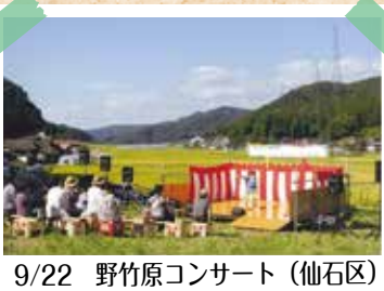
9/22 野竹原コンサート (仙石区)