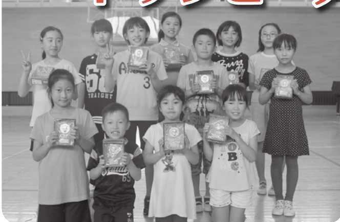
優勝したやまびこAチーム（上山）

9月28日、女性・若者等活動促進施設で、第3回青少年健全育成交流ドッジビー大会が開催されました。