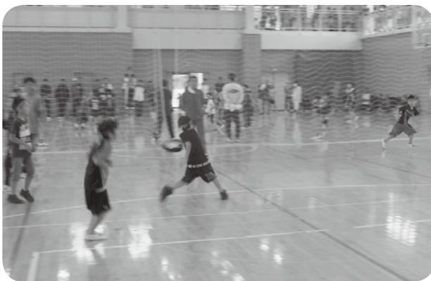
ドッジビー試合風景

試合の結果は、 優勝：やまびこAチーム 準優勝：大原Aチーム 3位：大原Bチーム