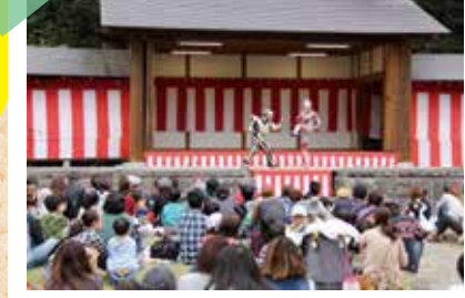
10/10 ウルトラヒーローショー