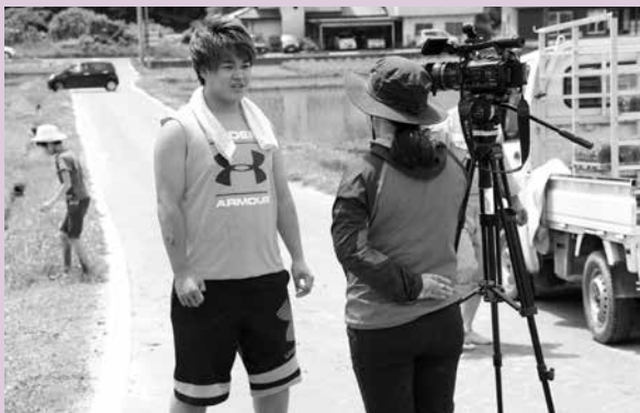
NHKの取材を受ける新成人