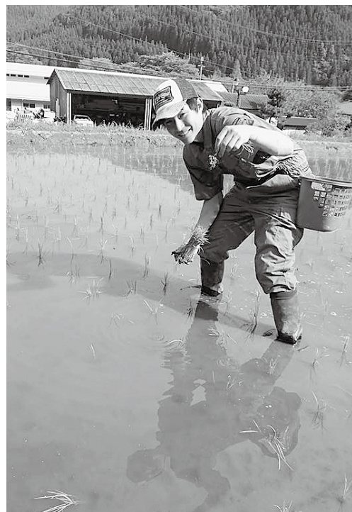
人生で初めて手植えをしました。 一本一本丁寧に植えました。 日に日に大きくなる稲に夏の訪れを感じます。