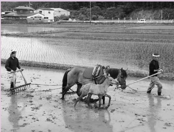
昔ながらの代かき

田植え終了後には、地元の方々の作った料理をおいしくいただき、楽しい時間を過ごしました。