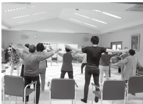
健康管理センターにて転倒予防教室に参加しました。 元気の秘訣は“笑いヨガ”です！

日々の活動を Facebook にてお知らせしていますの で、是非右記QRコードに てご覧ください。