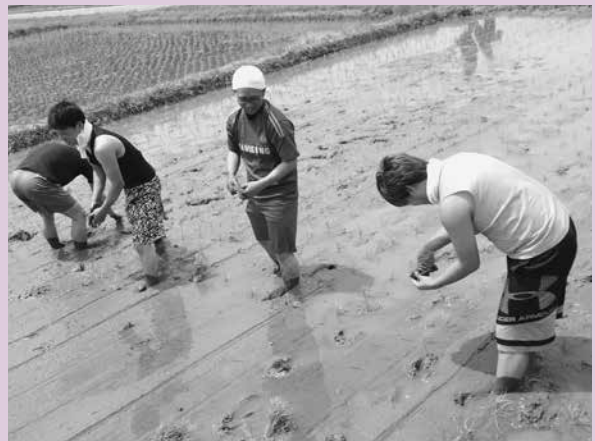
泥だらけになっても頑張って植えました！