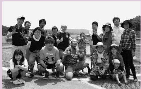
田植えが終わって記念撮影