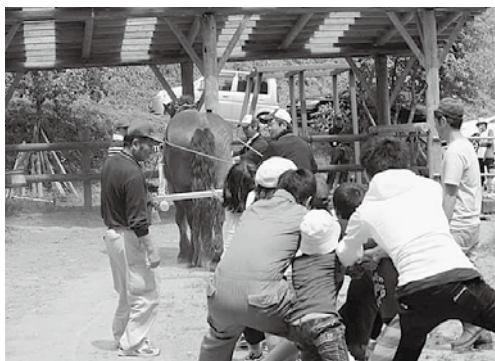
山で木材を運び出したり、田んぼの代かきをする馬と綱引き対決！ 負けた！

古殿町の五月は晴れる日が多いんですね。毎日爽やかな青空と日に日に強くなる陽射しのもと、農作業に挑戦したり、子供達と一緒に馬と綱引きしたり、転倒予防教室に参加したり…。僕にとって古殿町での生活は毎日初めての連続です。