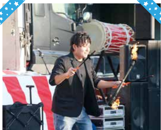
大道芸人ちゃむらいのパフォーマンス