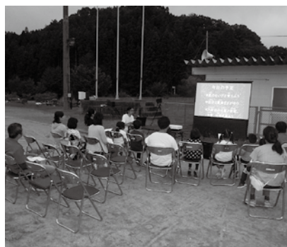
夏の星を覚えたよ！

8月12日(日)、町民グラウンドで星空観察を行い小学生及び保護者16人が参加しました。 JAL星見会の方々が先生となり、当初は三株高原での実施でしたが、当日の夜空の天候が不安定なため、急遽町民グラウンドでの開催へと変更となりました。当日は残念ながら曇りの天候となり、巨大望遠鏡を使つての星の観察を行うことはできませんでしたが、映像を使った夏の星座の話しや、星座の見つけ方、さらに15年振りに大接近中の火星のことなど、星空を見上げることが楽しくなるような有意義な時間を参加者は過ごしました。