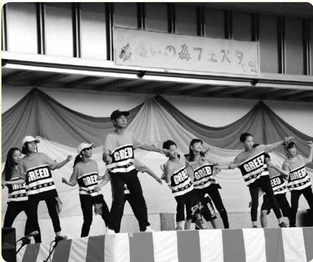
FULLSPO ヒップホップダンス