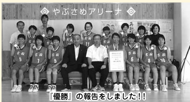
『優勝』の報告をしました!!

平成30年度の福島県中学校体育大会が7月22日(日)～24日(火)に実施されました。古殿中学校からは、バスケットボール競技、卓球競技の2つの競技に参加しました。