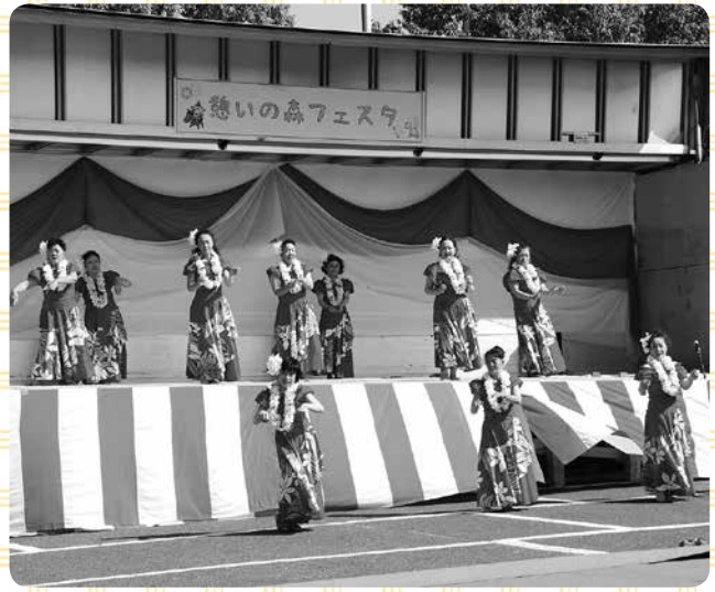
ア・リライフラの会