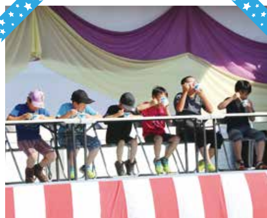
ところてん早食い競争