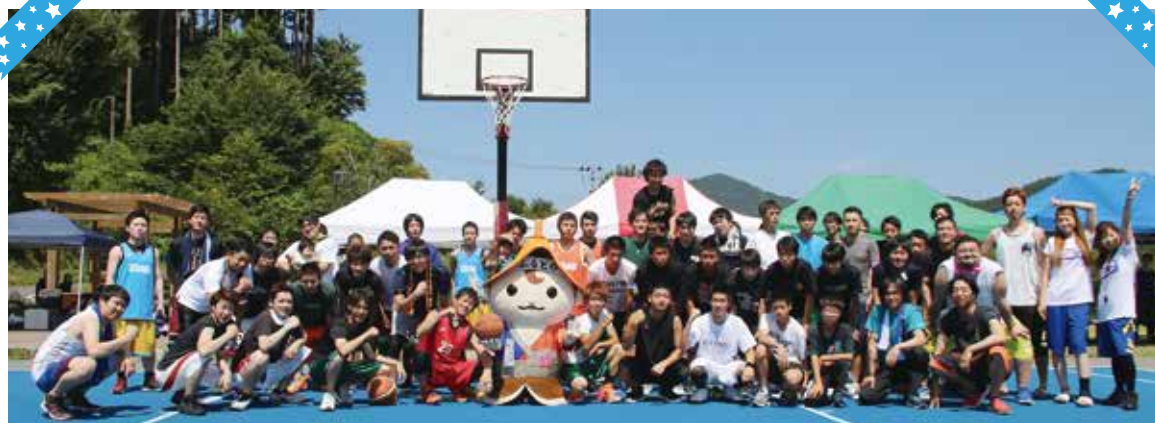
3 on 3大会の参加者で記念撮影