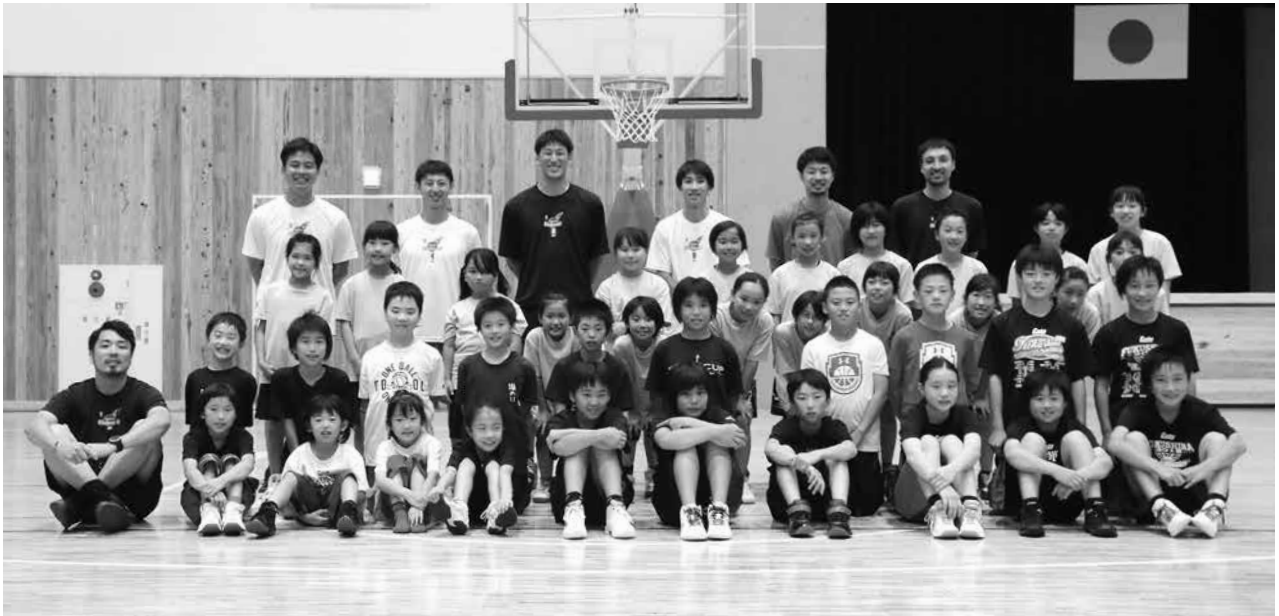
福島ファイヤーボンズの選手の皆さんとバスケットボールクリニックに参加した小学生