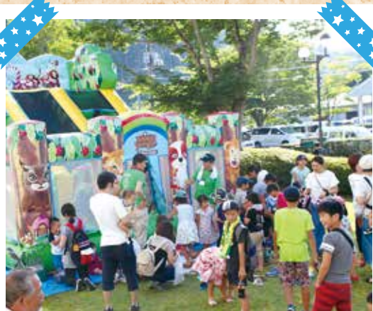
子どもたちに大人気だったアニマルジャングルスライダー