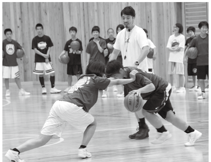
バスケットボールクリニック