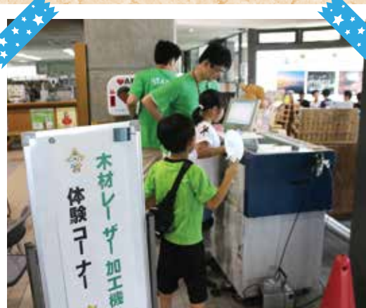
木工レーザー加工機体験コーナー