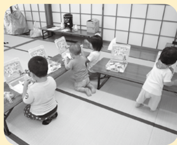
キッズ広場「エネルギーとカフェ」