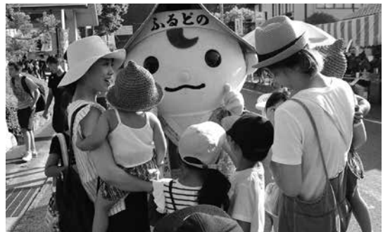
憩いの森フェスタ (8月4日)