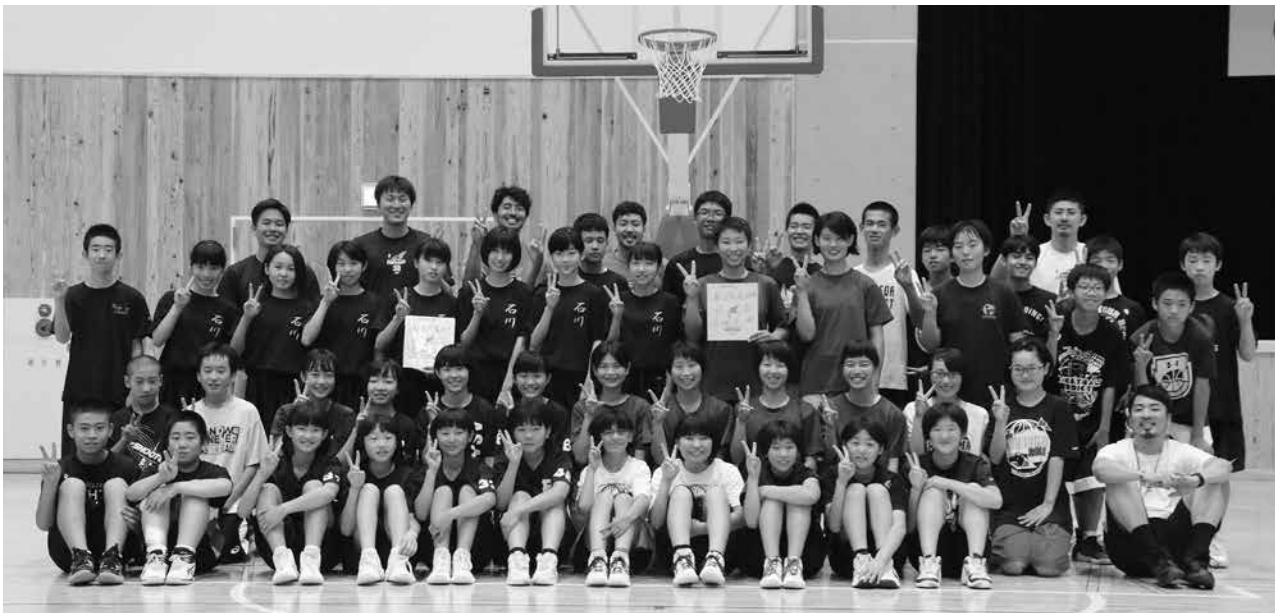
福島ファイヤーボンズの選手の皆さんとバスケットボールクリニックに参加した中学生