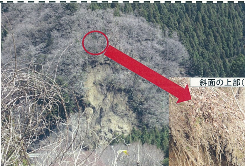
斜面の上部(H=40m)にはこのような亀裂が有ります

一日も早い交通解放に向けて努めてまいりますので、ご不便をおかけしますが、ご協力よろしくお願いいたします。