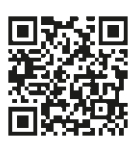
③ X(旧 Twitter)