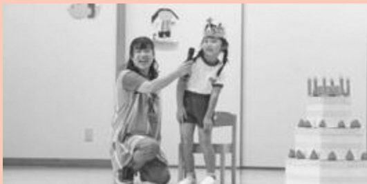
▲誕生日の園児にインタビュー