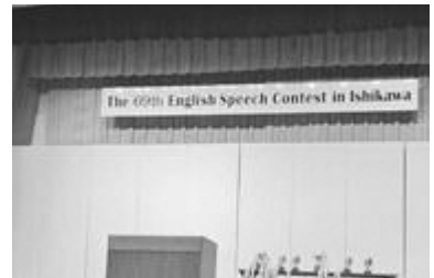
▲大会には生徒の家族も応援に駆けつけました

今年は、大会に参加する生徒を自発的な参加に任せました。英語が得意な2人の生徒がすぐに参加したいと言いました。この2人のほかに、3年生から志願した生徒はいなかったので、なぜ躊躇するのかと尋ねると、何人かの生徒は「英語を話すスキルに自信がない」と答えました。また、合唱の練習もあるので、大会に参加できるかどうか自信がないという生徒もいました。何人かの生徒を説得し、さらに1人の生徒が志願しました。