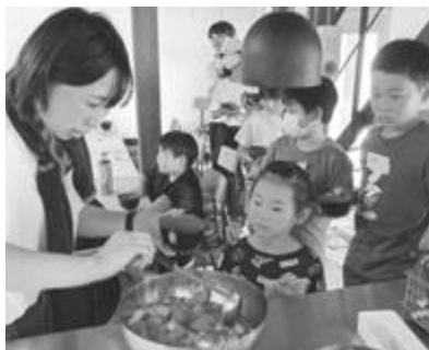
▲ 貝だくさんのフルーツポンチ