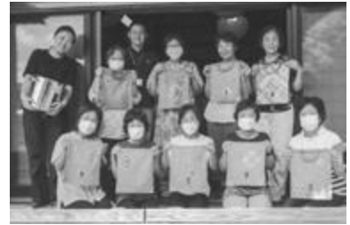
▲オリジナル柄の巾着が完成！

8月25日(金)、ふるどのオレンジカフェで、草木染め体験の講師をさせていただきました。オレンジカフェ(認知症カフェ)とは、認知症の方やそのご家族、地域住民、介護や医療の専門職員など、誰でも気軽に集える場所で、日常のお悩み相談や世間話、情報交換などが出来るコミュニケーションの場として、全国各地で運営されています。古殿町では社会福祉協議会・地域包括支援センターさんの主催で、コスモス荘にて毎月25日に開催されています。今回は特別に、会場を昨年改修工事を終えた大網庵に移しての開催となりました。