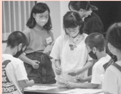
みんなからサインをもらいます