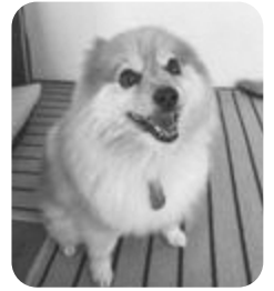
「ココア」です。 よろしくね!

ひろばは皆さんが参加するページです お知らせしたいことや学校での出来事、自慢のペットや 趣味など何でもお寄せください。みなさんにご紹介します。