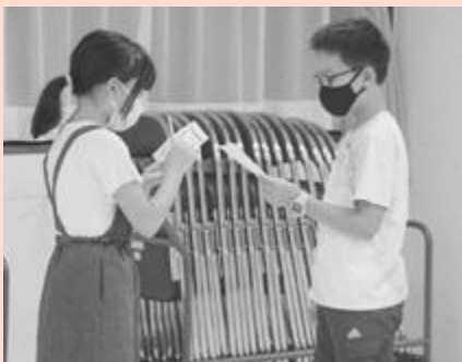
英語でインタビューしてみよう