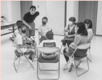
曜日を英語で言えるかな?