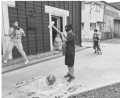
▲ スイカはどこかな～？