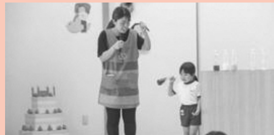
▲ペットボトルを振ると水の色が変わりました

8月30日(水)、ふるどのこども園で8月生まれの幼児部(3歳児から5歳児)の園児たちの誕生会が行われました。8月生まれの園児たちに誕生日プレゼントや歌でお祝いをしました。会では、手品の出し物が披露され、手品が成功すると園児たちは大興奮でした。