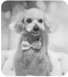
「アスラン」です。 よろしくね!