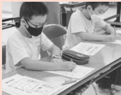
真剣に考えています