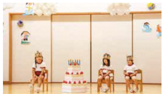
ふるどのこども園誕生会(8月30日)