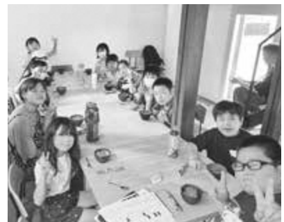
▲ みんなでいただきます♪

2日目は前半に絵画などの課題に取り組み、後半にフルーツポンチ作りを行いました。私の幼少期はこのようにみんなで集まるイベントではよくフルーツポンチを作って食べたものですが、今回初めてフルーツポンチを食べる子がいたり、「フルーツポンチって何?」と聞かれたりしてジェネレーションギャップを感じました(笑)