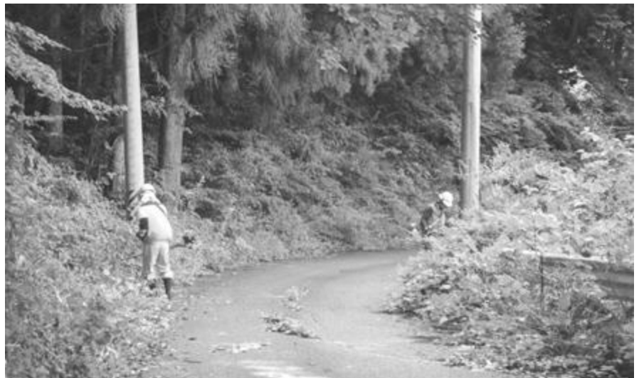
ボランティア活動の様子▶