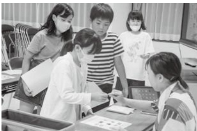
▲ 全問正解はなまる

今回初めて挑戦した活動として、「謎解きゲーム」があります。英語を使って謎解きに挑戦し、仲間と協力してお題をクリアしながらゴールを目指しました。子ども達はドキドキしながらもゲームを楽しんでいてよかったです。小学校では、上学年(4,5,6年生)になると外国語の授業が増え、この英会話教室ではそんな子ども達が知っていることやできることを広げる機会になればいいなという気持ちで毎時間活動を考えていました。みんな楽しみながら学んでいたようで私も嬉しかったです。学年が上がるごとに内容は難しくなっていますが、楽しむことを忘れずにこれからも英語を勉強して行ってほしいと思います。