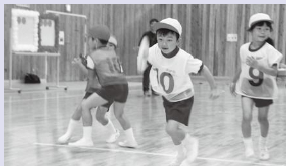
▲ぞう組の紅白リレー