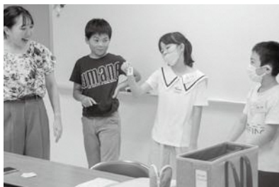
▲ ito (いと) ゲームにチャレンジ