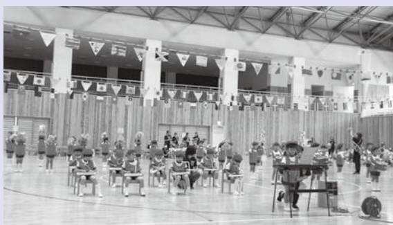
▲ぞう組（5歳児）・きりん組（4歳児）の鼓笛演奏

園児たちは、運動会までにたくさんの練習をし、当日は堂々とした演技や元気いっぱい競技を披露してくれました。また、園児だけでなく、先生や保護者の皆さん全員で一生懸命に取り組み、楽しい運動会になりました。