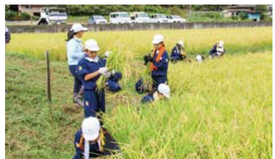
古殿小学校稲刈り体験(9月22日)