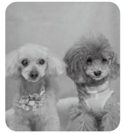
「アスラン & Amu」です。よろしくね!

ひろばは皆さんが参加するページです お知らせしたいことや学校での出来事、自慢のペットや趣味など何でもお寄せください。みなさんにご紹介します。