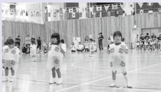
▲ばんだ組（3歳児）のラーメンたいそう