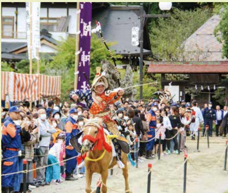
▲大勢の人の前で披露された流鏝馬

10月7日（土）、8日（日）、町最大のイベントである古殿八幡神社例大祭・やぶさめフェアが古殿八幡神社で開催されました。昨年まで令和元年東日本台風や新型コロナウイルス感染症の感染拡大の影響により中止となっていました。5年ぶりの開催となりました。