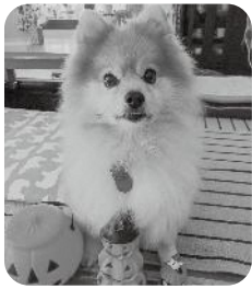
「ココア」です。よろしくね!