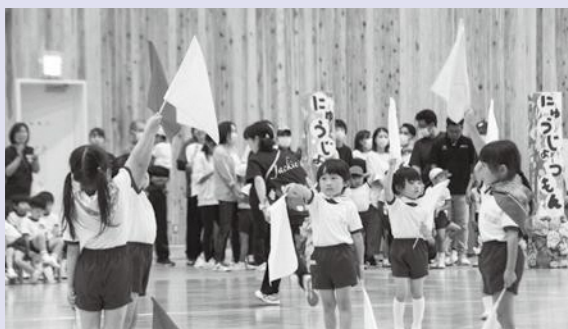
▲きりん組のフラッグを使った演技