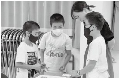
▲ 友達にインタビュー