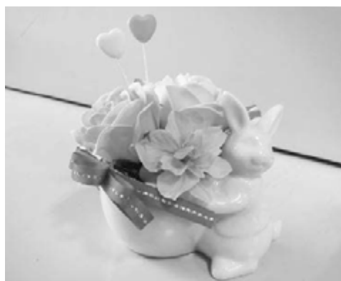
完成した作品がこちら！