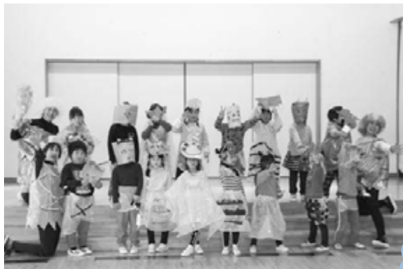
▲▶お面やかぶり物、洋服で鬼になりきって記念の1枚。左はきりん組（4歳児）、右はぞう組（5歳児）。