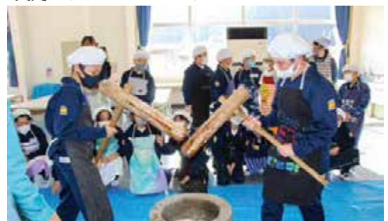
古殿小学校収穫祭(1月13日)