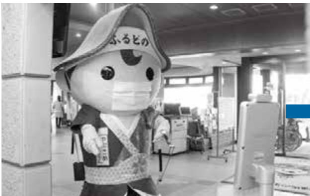
① 役場の2階で検温・消毒・受付

また、新型コロナウイルス感染予防を徹底しての実施となりますので皆さまのご協力をお願いいたします。