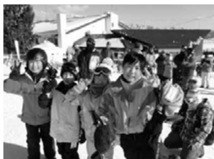
みんなで楽しく滑りました！

1月15日(日)、2月5日(日)にスキー・スノーボード教室が猪苗代スキー場にて行われました。小学生から一般の方まで48名が参加しました。