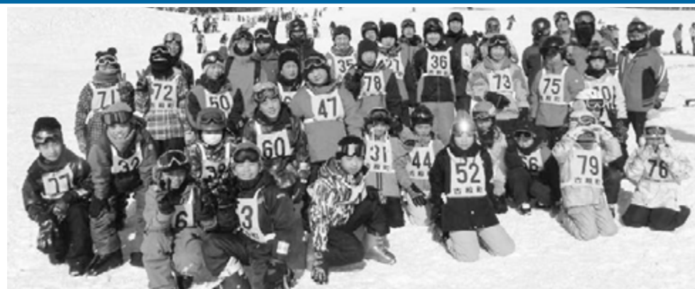
天候にも恵まれました！