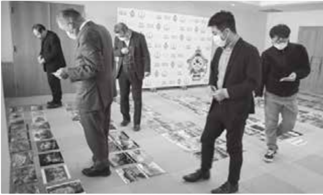
◀ 作品を審査している様子

2月6日(月)、役場大会議室で古殿町フォトコンテスト審査会が開催されました。部門ごとに最優秀賞1点、優秀賞2点、入賞3点、また全作品から特別賞2点が選ばれました。今年で13回目となる本コンテストは、全部門を通して町内外55名から294点の応募がありました。表彰された作品については、広報ふるどの4月号でお知らせします。