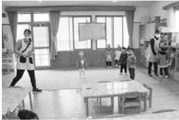
▲▶それぞれの組をまわり、豆まきを楽しんでいます。左はぱんだ組（3歳児）、右はうさぎ組（2歳児）。