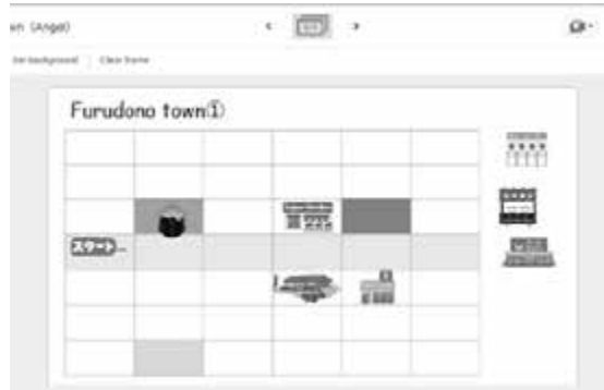
▲ 児童たちはこのインタラクティブマップを使って、道を教えたり尋ねたりしていました。