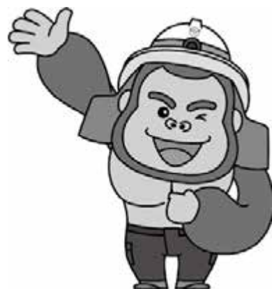
須賀川地方広域消防組合 イメージキャラクター