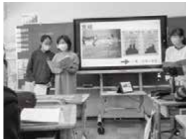
▲5年生はプレゼン発表が上手