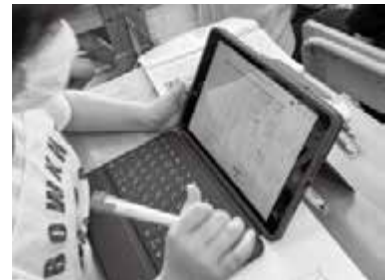
▲2年生はiPadを使って創作活動ができるようになりました!