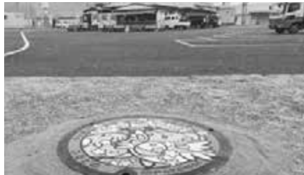
▲奥の駐車場付近に設置されています