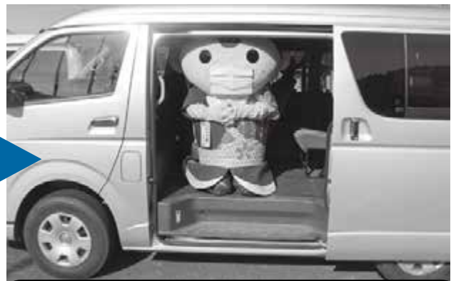
② 車で待機(順番が来たら電話でお呼びします)