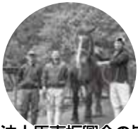
NPO 法人馬事振興会の皆さん (お花見馬車)