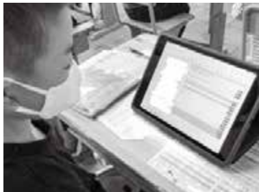
▲表計算アプリを使いこなす3年生

小学校で本格的にタブレット端末の持ち帰り学習が始まって半年が経とうとしています。おうちでの使い方はいかがでしょうか?自宅用のタブレット端末を使ったり、ゲーム機器でネットとつながっていたりと、令和を生きる子ども達はいつどんな時でもICT機器を使えるのがあたりまえの環境にあります。その中でトラブルに遭遇しないように、今回はどうしたらおうちで有効にICT機器を活用できるか事例を挙げて紹介していきます。