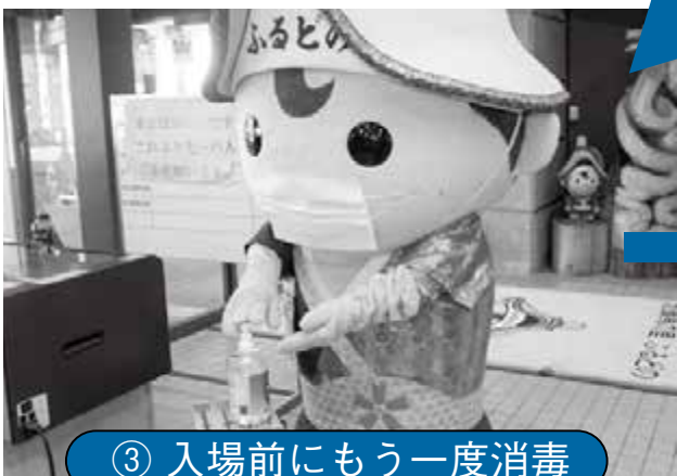
③ 入場前にもう一度消毒