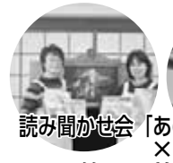
読み聞かせ会「あのね」の皆さん