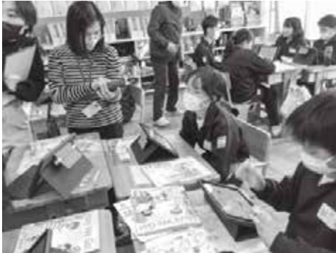
▲ 古殿町の建物やお店を、"Go straight for ○○ blocks" "Turn right/left at ○○ corner" "You can see it on your right/left" などの文章で、児童が英語で道案内をしてくれたのです。