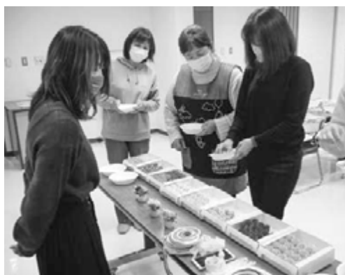
どの色にするか迷っちゃう！

完成した作品を手にし参加者からは「部屋のインテリアにぴったり！」「また来年も参加したい！」などの声があがりました。