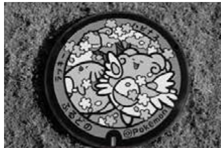
▲かわいらしいデザインの「ポケふた」