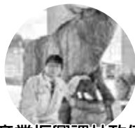
産業振興課林政係 (組手仕で家具作り)