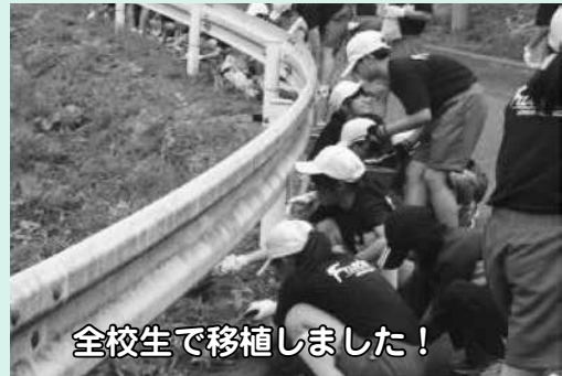
全校生で移植しました！