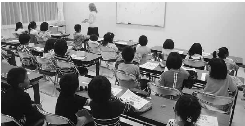
たくさんの受講者により行われました

今後は、小学校高学年の生徒を対象とした英会話教室を9月に予定しています。8月下旬に募集を行いますので、興味のある方は町公民館にお問い合わせください。