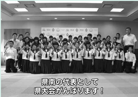
県南の代表として 県大会がんばります！

中体連県大会の出場を報告するため、役場を訪問しました。町長さん、副町長さん、教育長さんから大会へに向けて激励の言葉をいただきました。また、「全校生徒132名のうち、32名の生徒が県大会へ参加することができるのは素晴らしいことで、自信を持ってほしい」、「この伝統を後輩に繋いでほしい」とのお話しもいただきました。県大会に向けての意気込みが、更に高まる機会となりました。特設陸上部、女子バスケットボール部、ソフトボール部、柔道部の活躍が期待されます。