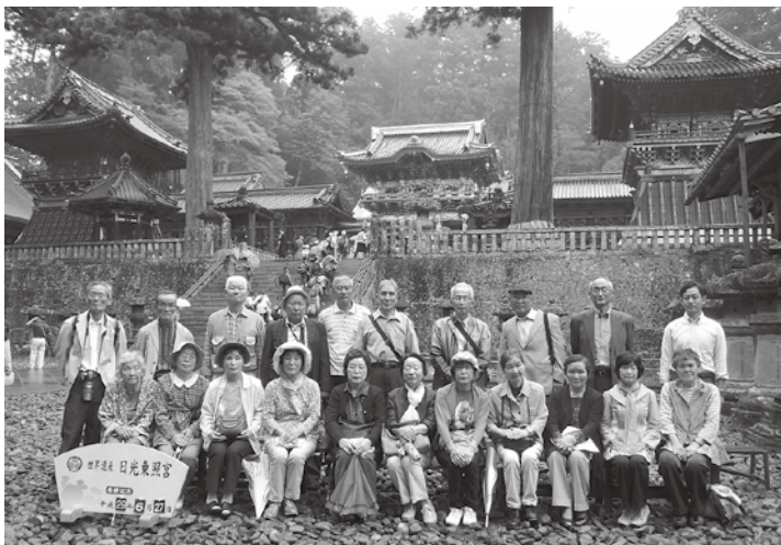
陽明門前での集合写真

また、6月27日(火)には町外研修として栃木県日光市を訪れ、日光東照宮や今年の4月に新たにオープンした日光歴史民俗資料館を見学しました。日光東照宮は平成の大修理として、第4期の修理時期となっておりますが、日本を代表する最も美しい門といわれる陽明門 ようめいもん の改修は終了しており、参加者は建築された当時の美しさを取り戻した陽明門に感動していました。