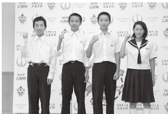
柔 道 部