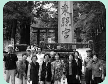
悠遊学級 日光東照宮にて