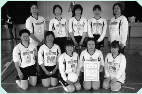
準優勝した竹貫バレーボールクラブ

上松川大石SBC・竹貫バレーボールクラブは、8月27日(日)の県中大会に出場となりましたので、みなさん応援よろしくお願いいたします。