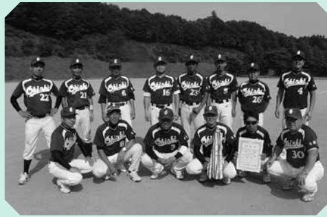
優勝した上松川大石SBC