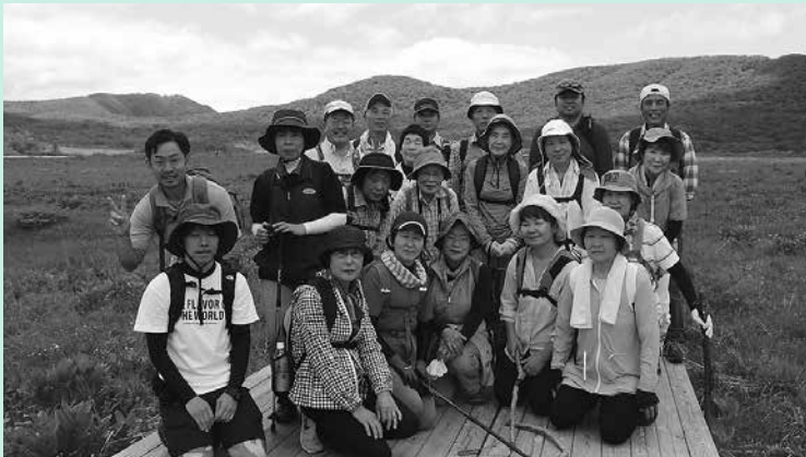
雄国沼湿原での集合写真

雄国沼は猫魔ヶ岳の噴火によってできたカルデラ湖で、湿原は国の天然記念物に指定されています。ブナなどの広葉樹に囲まれた片道約3kmの探勝路には、様々な植物だけでなくハルゼミなどの昆虫も生息していました。探勝路を抜け湿原に出ると、青空と開放的な景色が広がり、さわやかな風が感じられました。特にレンゲツツジが見ごろを迎えており、高山の初夏を楽しむことができました。