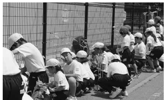
古小ひまわり定植 (6月20日)