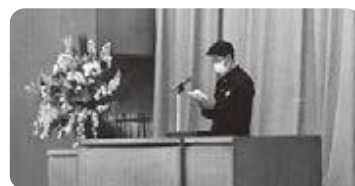
在校生代表歓迎の言葉