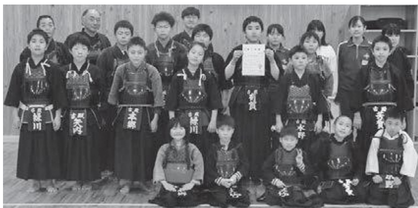
一年間頑張りました！