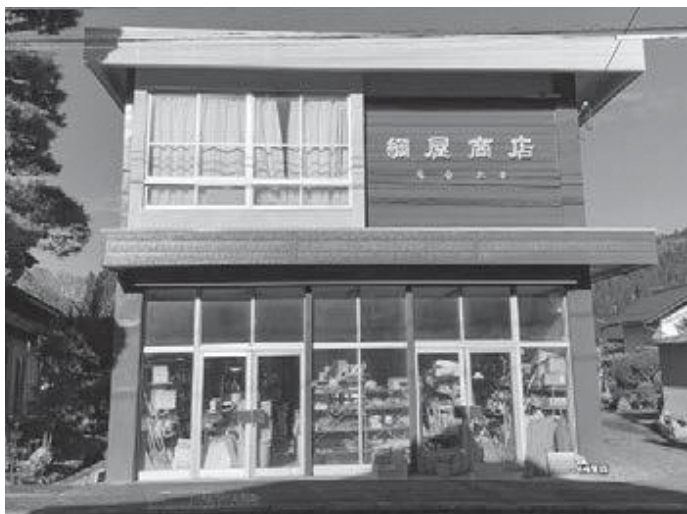
▲網屋商店さん（松川字横川地内）

5月からはミニイベントを企画していきますので、ぜひふらっと遊びにいらしてくださいね！開催情報はSNSや網屋商店店頭にてお知らせいたします。