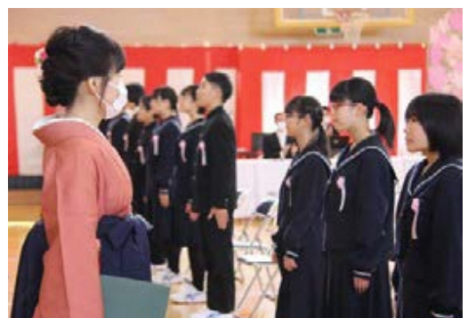
古殿小学校卒業式(3月11日)