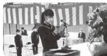
新入生代表誓いの言葉

<知> 自分から進んで学習してほしい。授業では、自分の考えを積極的に発言したり友だちの考えを聞いたりして理解を深めるとともに、家庭学習では自分の苦手な内容などを考えて、自分で計画を立てて学習することが大切である。また、古殿中には「学習の心得五ヶ条」という、学習に臨む大切な姿勢についてまとめられたものがある。日頃から意識して生活してほしい。