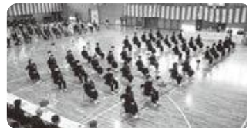
立派な態度の新入生

また、入学式に当たっては新2、3年生が新入生のために式場作成や清掃などを一生懸命行いました。早速、「先輩」としての素晴らしい姿を見ることができ、とても嬉しく思います。本当にありがとうございました。なお、校長式辞では、以下の3つの話をさせていただきました。新入生が今後の中学校生活の中で意識し、大きく成長することを願っています。