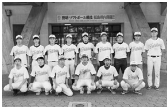
選手の皆様お疲れ様でした！