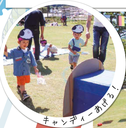
チャンピオンあげる！