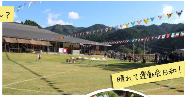
晴れて運動会日和！