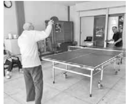
▲大人限定の卓球カフェも開催しました！