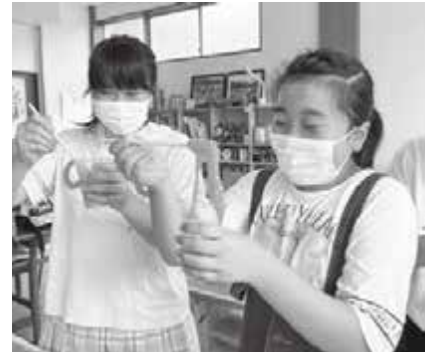
▲スライム作りに夢中！