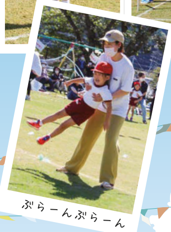
ぶらーんぶらーん