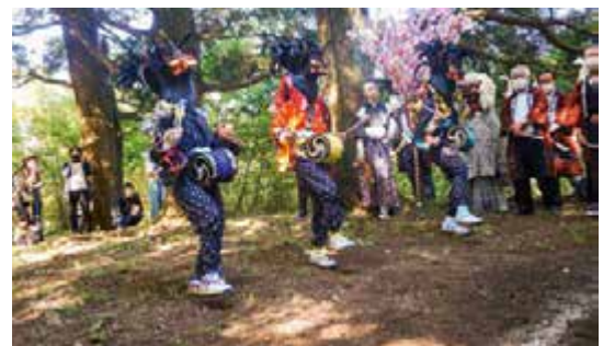
論田湯殿山祭典(10月2日)