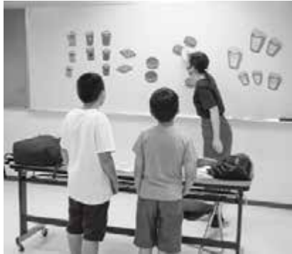
▲英語でハンバーガーを注文

これで今年度の公民館での小学生向け英会話教室は終了となります。今年度も前期・後期と多くの受講者にご参加いただいて誠にありがとうございました。サポートして下さった公民館のスタッフやお忙しい中子ども達を毎回送迎して下さったご家族の方々には心から感謝申し上げます。来年度もワクワクするような心おどる活動をたくさん考えておりますので、またのご参加を心からお待ちしております。