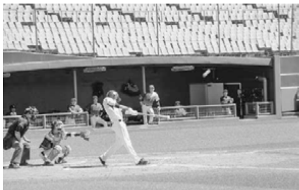
ナイスバッティング！！