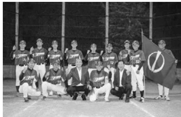
ベスト16入りを果たした古殿チーム