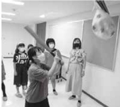
▲ピニャータ祭り最高！