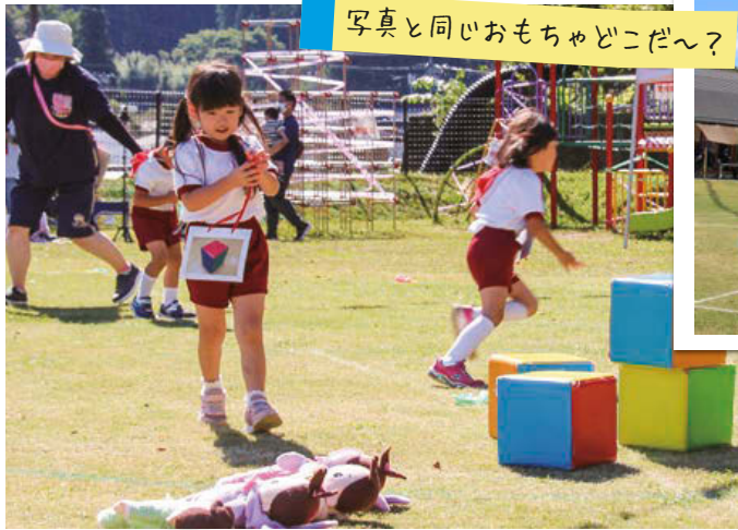
写真と同じおもちゃどこだ〜？