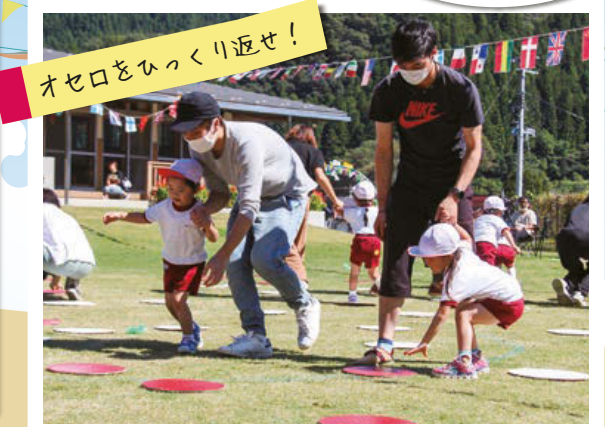
オセロをひっくり返せ！