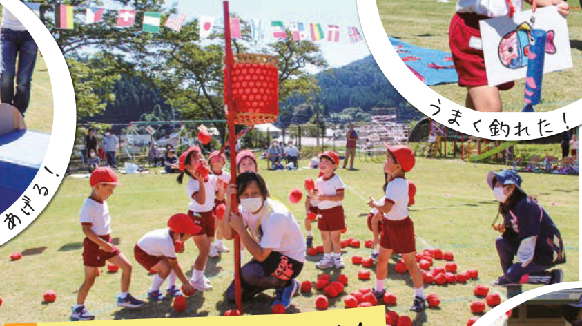
たくさん玉入れるぞ！