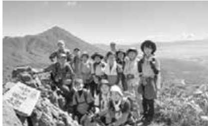
絶景をバックに記念撮影!!

ハイキング後はラビスパ裏磐梯で疲れを癒し、道の駅猪苗代にて、新鮮な野菜や特産品を購入し充実した1日となりました。