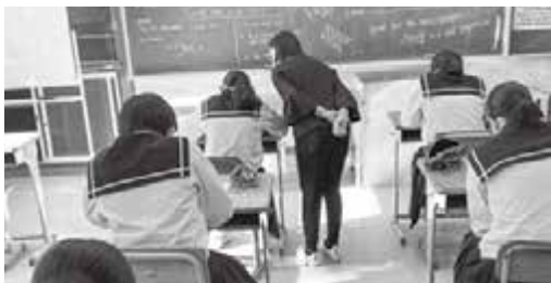
▲英検模擬試験で小論文を書いているところ

9月26日（月）、小学校で初めての授業がありました。2年生の生徒さんはとても積極的で、熱心でした。私はフィリピンの文化について短いプレゼンテーションを行い、フィリピンの本物のお金を見せてあげました。フィリピンについて興味深い質問をしてくれました。ある生徒が「フィリピンには日本にはいない魚がいるのか」と聞いてきました。見事な質問でしたが、私は答えることができませんでした。私は手拍子ゲームと「バハイ・クボ」というフィリピンの伝統的な歌を教えました。授業の最後には、多くの生徒が私の周りに集まり、さらに質問をしてくれました。興味を持ってくれたようで、とても嬉しかったです。次回の小学校での授業が楽しみです。