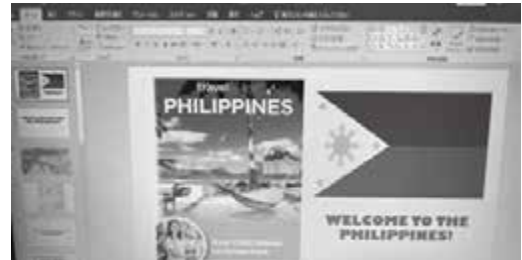
▲フィリピンの文化についてのプレゼンテーション