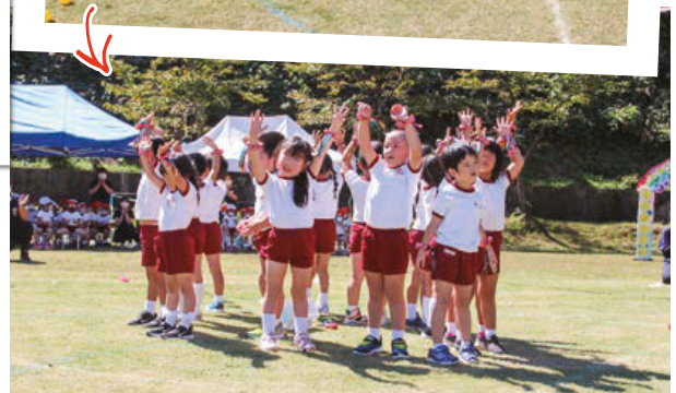
バルーンを使っでの演技