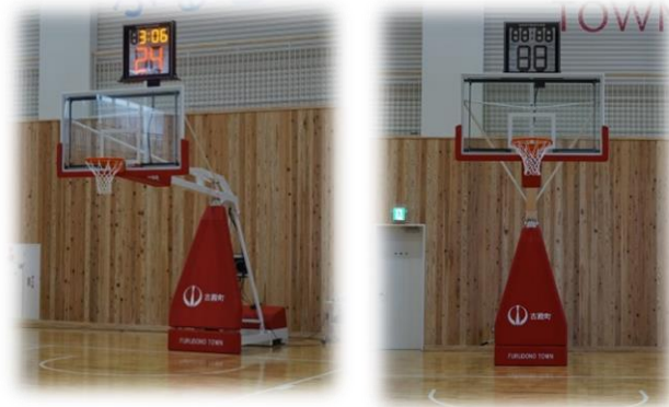
移動式バスケットゴール