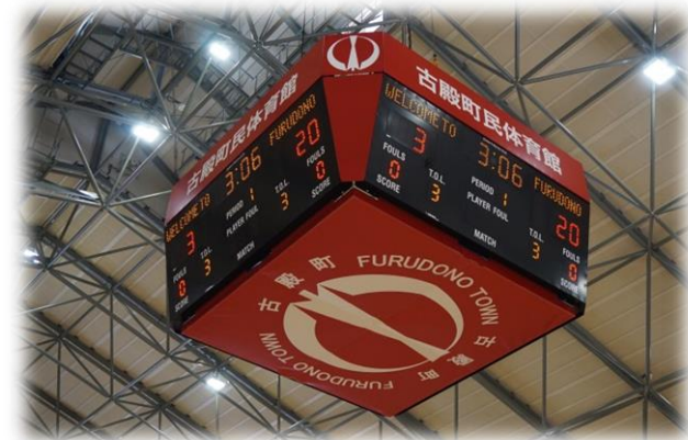
センターハングスコアボード