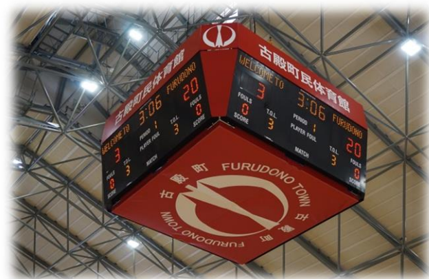
センターハングスコアボード