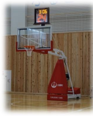
移動式バスケットゴール