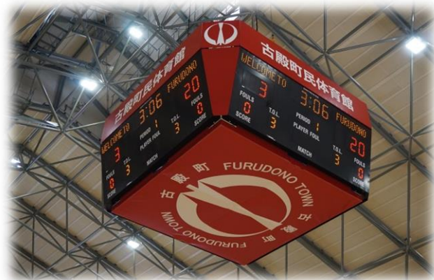
センターハングスコアボード