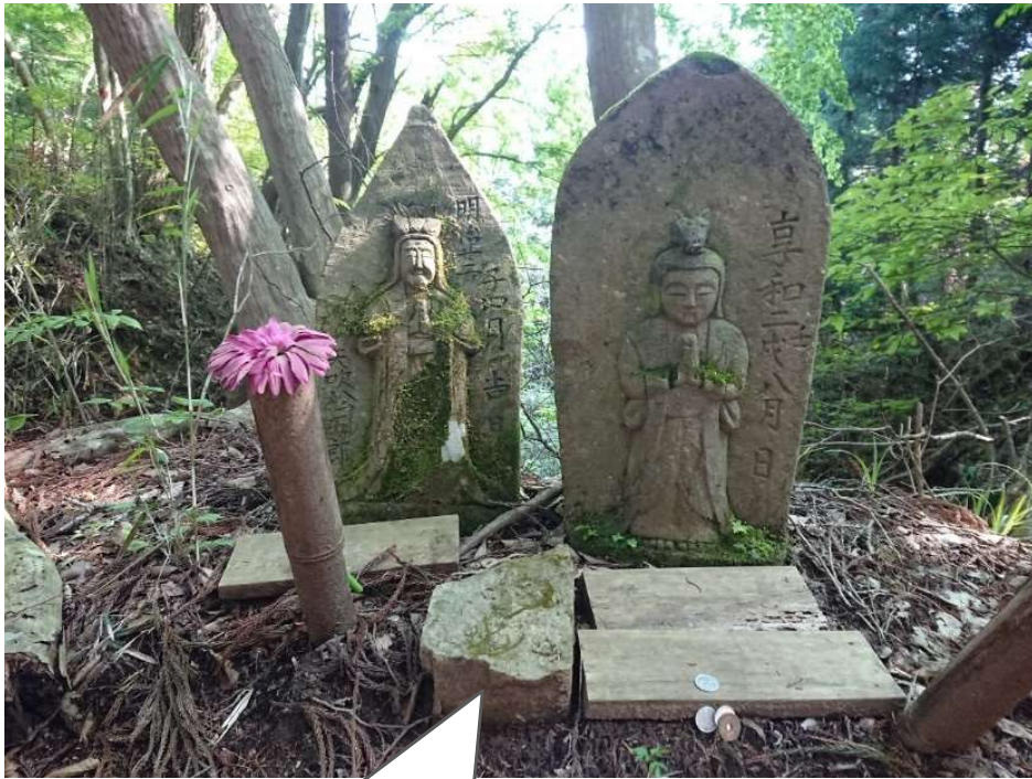
鎌倉岳登山口周辺の馬頭観音様