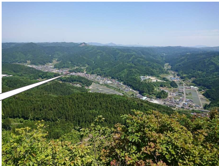
鎌倉岳より眺める古殿町の町並み