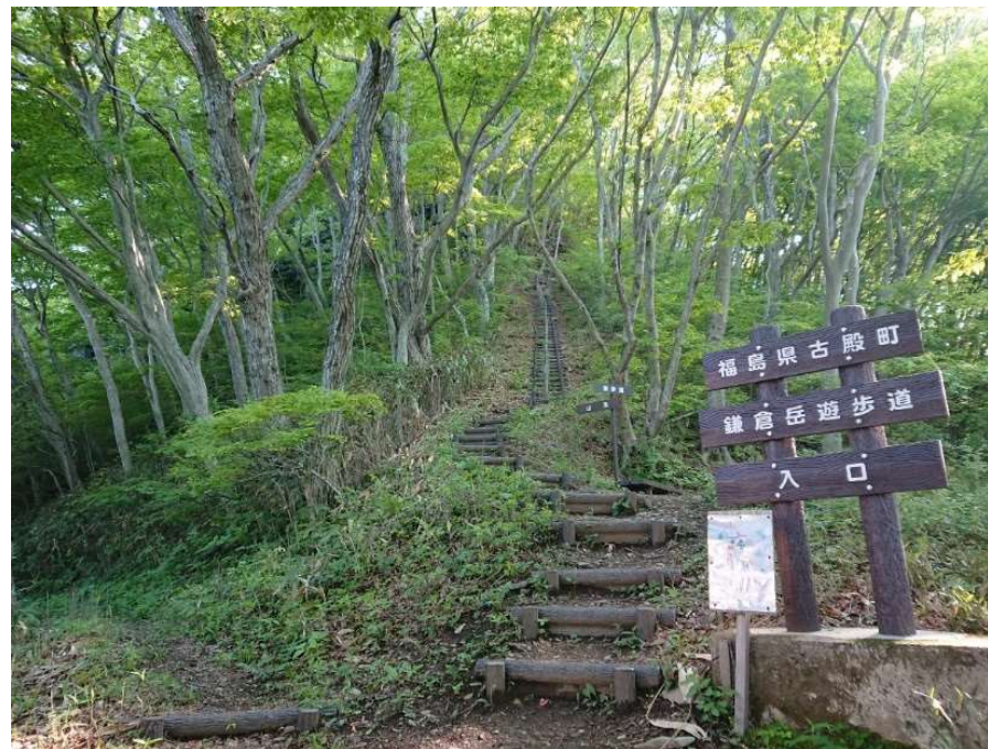
鎌倉岳遊歩道入口