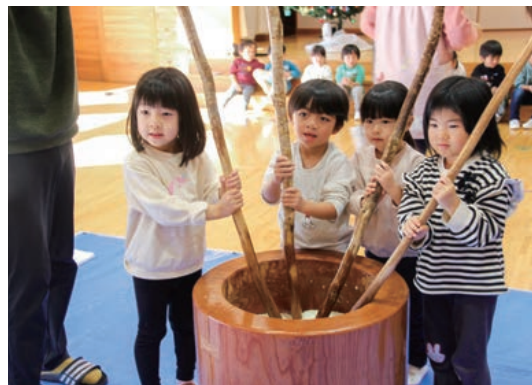
ふるどのこども園餅つき会(12月16日)