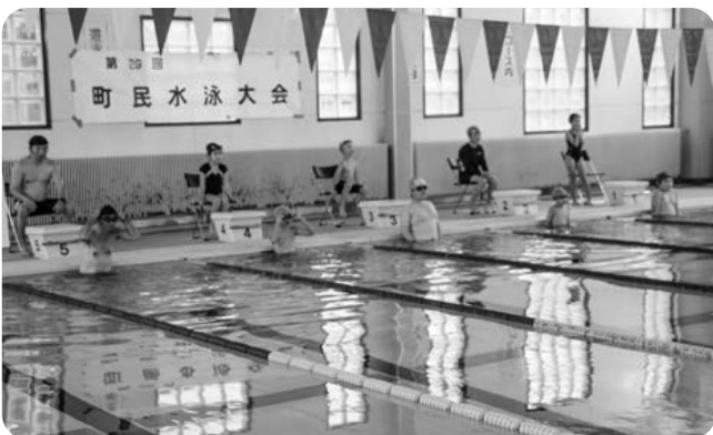
団体競技 100 mリレー