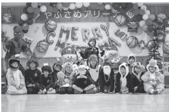
▲様々な仮装で楽しめました