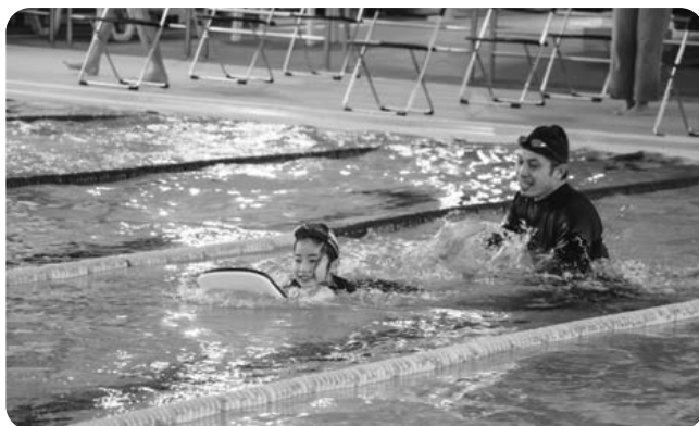
家族でチャレンジ(ペア) 50m