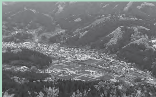
▲鎌倉岳山頂からの景色