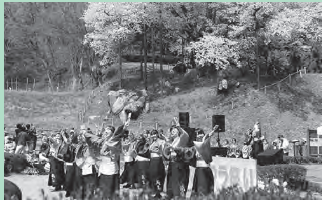
▲ミネルバによるよさこいを披露

18日(土)に満開を迎えた越代のサクラは、17日(金)から19日(日)までの間ライトアップされており、昼とはまた違う姿を見せていました。