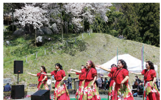
上段：鎌倉岳山開き 下段：越代のサクラ祭り