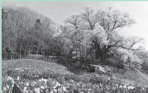
▲満開時の越代のサクラ