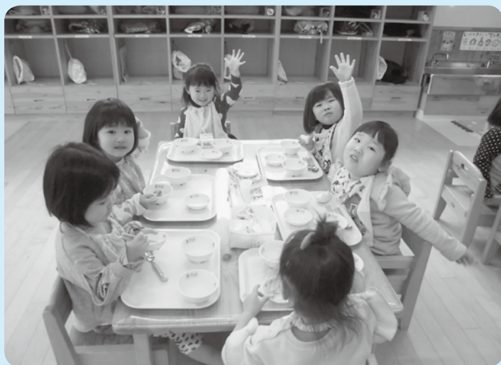
こども園の給食の様子