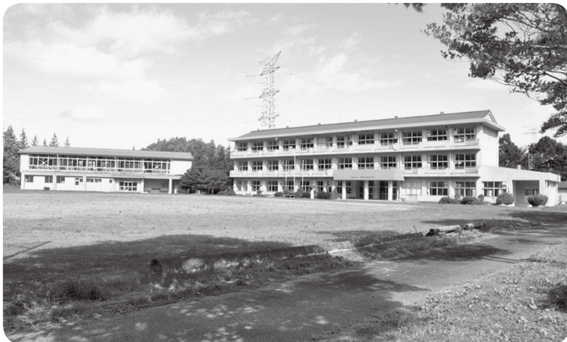
利活用の提案があった旧論田小

12月6日に行われた議会全員協議会では、旧論田小学校校跡地利活用等についての説明がありました。