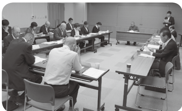
古殿町第7次振興計画審査委員会の様子

木質チップ等を燃料とし、直接燃焼させるのではなく、加熱することで発生させたガスで発電するもの。