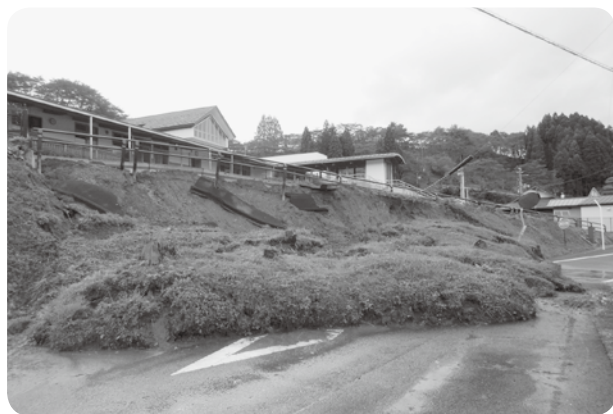
こども園の崩落状況

A 農道が4ヶ所、林道が16ヶ所、町道、河川等が24ヶ所です。民生費の復旧費については、こども園の敷地周辺です。