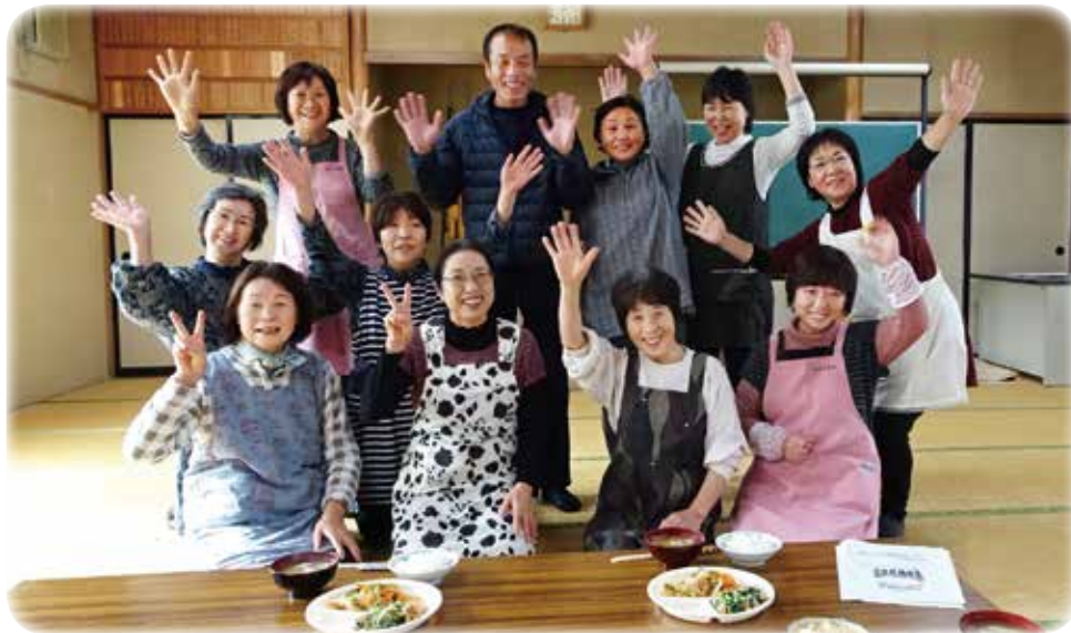
とにかく元気一杯な田口のお母さんたち

「10年先まで元気に過ごせるような活動」を目指していると言うだけあって、催しも「健康教室」「桜ウォーキング」「ペーパークラフト」「料理教室」などその内容も多彩だ。