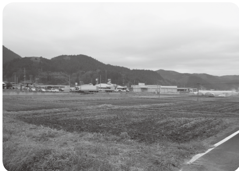
町の活性の拠点・拡張が求められる道の駅

佐川 町活性の拠点として、新たな道の駅整備計画に次年度から取り組むべきと考えますが、どうか。 町長 平成12年度に建築し耐用年数が木造かつ店舗用であるため、令和4年度となることから周辺整備も含め、今後検討してまいりたいと考えております。