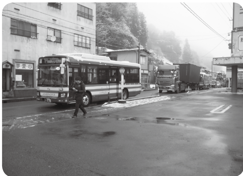
一律助成が求められている高校通学費

町長 平成12年度に建築し耐用年数が木造かつ店舗用であるため22年であり、それを経過するのが令和4年度となることから、周辺整備も含め、今後検討してまいります。