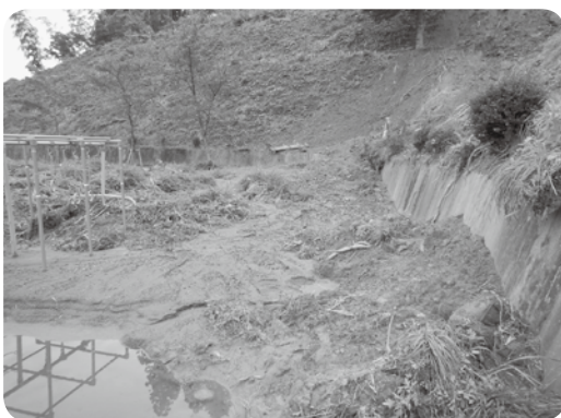
こども園の南側崩落状況