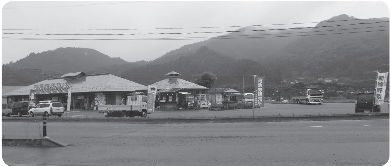
町の核としての役割を担うおふくろの駅