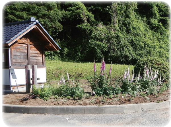
花が植えられたゴミステーション周辺