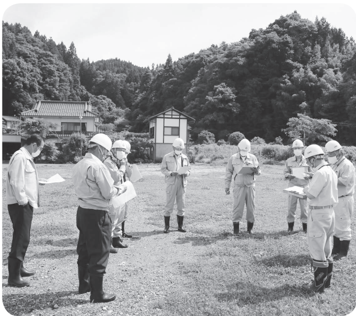
宅地造成予定地（旧保育所跡地）の現地視察