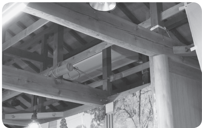
新しくなったおふくろの駅の空調設備

10億円の財政調整基金から5億円を取り崩し、予算を作成した訳ですから、町民に等しく隅々まで光を当てるといふ初心に返って町政に携わって頂きたいと質問します。