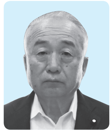
わらがや なおよし 議員 藁谷 直吉