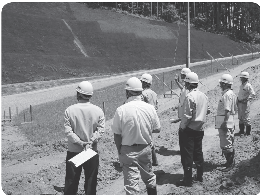
町道竹貫田いわき線の現地視察

産業建設常任委員会は、町道竹貫田いわき線、竹貫古殿線と旧大原小学校跡地の視察を行い、状況の確認を行いました。