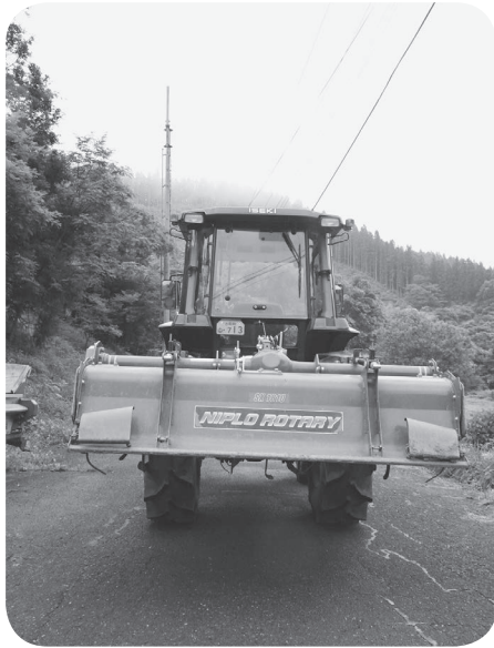
条件つきで公道の走行が認められたトラクター

そうした中、農業機械による作業時や移動時の事故の発生件数が年々増加傾向にあり、その安全対策が大きな問題となっている。更にはこの春、農耕トラクターに係る道路運送車両法の見直しによる保安基準の緩和が取られたことで、運転免許