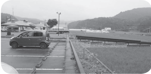
拡張が期待される道の駅