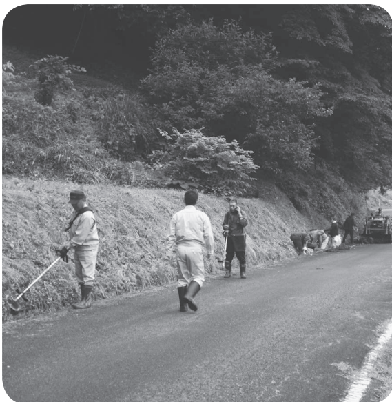
昨年の道路愛護デーの様子