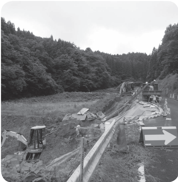
大久田地内の災害復旧工事

町長 中止後の対策は具体的に考えているのか。関係機関と協議したいと考えています。