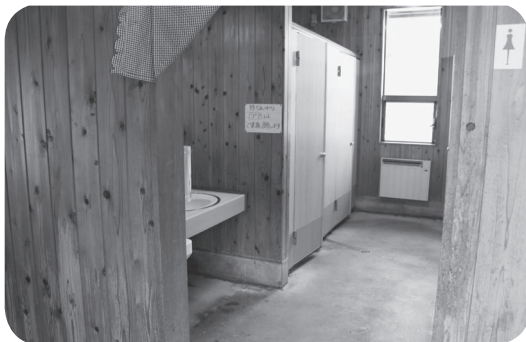
修繕されたおふくろの駅のトイレ

木戸 大原小跡地の木材乾燥施設、今後はどう進めるのか。 町長 今後、町のホームページ等も活用しながら町内外に対してPRを進めていきたいと考えております。