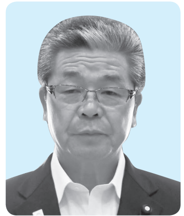
のざき よしひこ 議員 野崎 喜彦