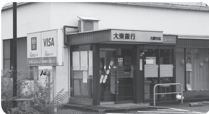
町指定金融機関の大東銀行

6月12日に行われた全員協議会では、大東銀行古殿支店より、役場庁舎内での営業について町に相談があった件が議題にあげられ意見交換が行われました。