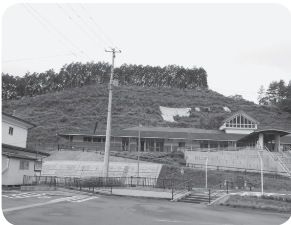
台風により法面が崩落したこども園

町長 安定勾配を確保した形で実施したいと考えていますが、現在関係機関及び関係者と協議を進めているところであり、早期に工事が行えるよう取り組んでまいります。財源については、緊急防災・減災事業債を予定しております。