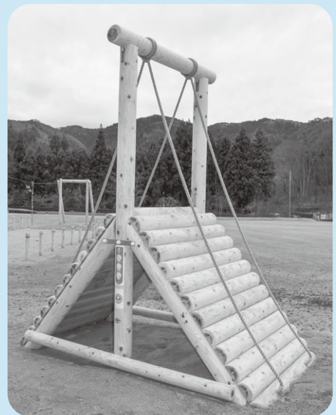
憩いの森公園に設置された木製遊具