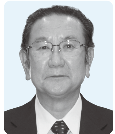
おかべ じゅんいち 議員 岡部 淳一