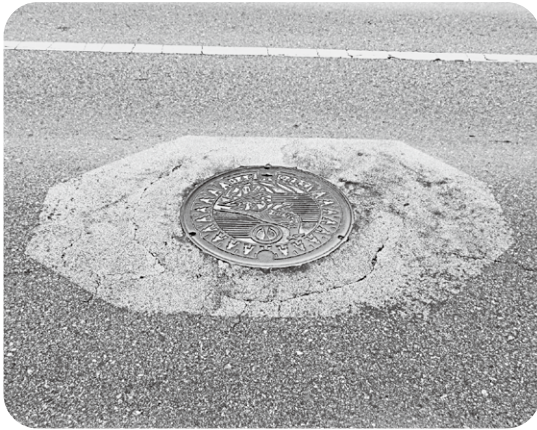
老朽化により騒音、振動等の改善が望まれる下水道施設

鈴木 上水道、下水道とも軟弱地盤に埋設されているところもあるが現状は。 町長 施工時に安定処理を施しましたが、管の歪みや不等沈下が確認され、改修および補修を計画しています。