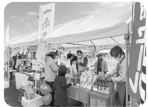
紫波町産業まつりの様子

藁谷 町の交流拡大活性化のために、新たに姉妹都市か交流都市を締結する考えは。 町長 そういった機会があれば、前向きに対応したいと考えます。