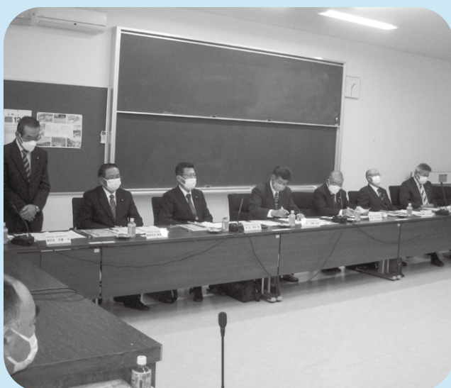
只見町議会で研修を受ける委員

議会運営委員会は11月17日から18日、福島県南会津郡只見町議会で議会活性化の取り組みについて視察研修を行いました。