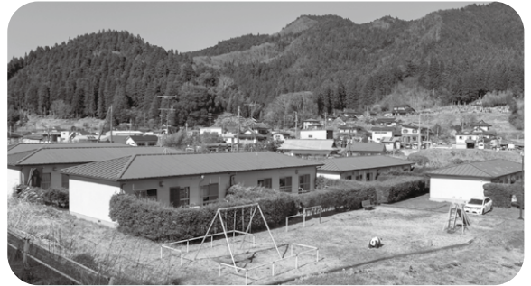
昭和60年度建設の西渡団地