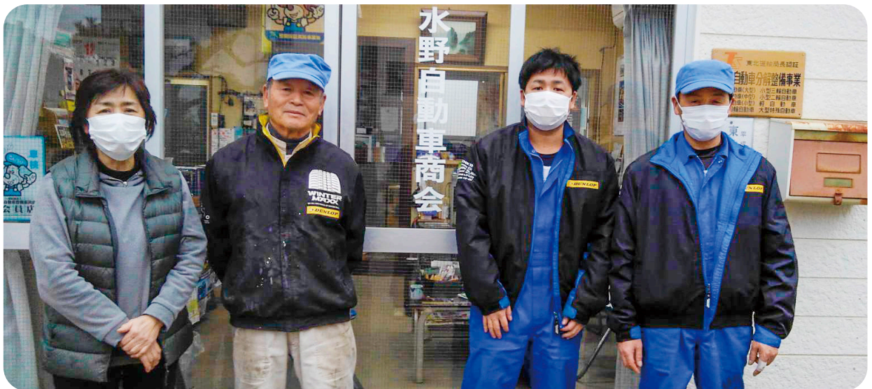
水野自動車商会の皆さん

自動車は町民の足に欠かせないものとなっています。その中で求められるのは、安心安全が第一だということです。お客様の様々なご要望に沿えるよう、親身になって相談を聴き、自動車のトータル・プランニングで町民の方に貢献していきます。