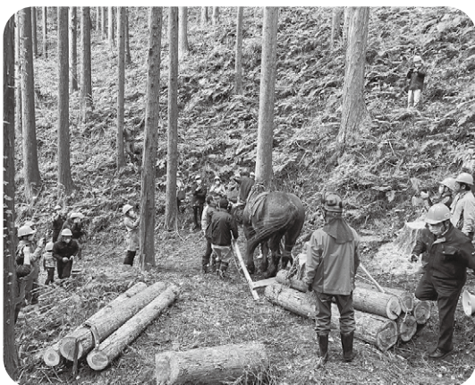
振興が期待される林業

町長 課題が山積する中において、町民のご支持がいただけるのであれば、引き続き町政運営に当たりたいと考えております。