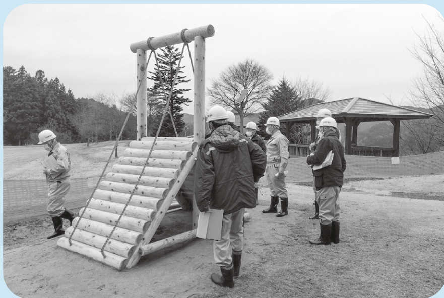
憩いの森公園の遊具を視察する委員

総務常任委員会は憩いの森公園遊具設置工事、大網庵改装用途変更工事、町道越代熊倉線改良工事等を視察し、状況を確認しました。現地視察後、マイナンバーカードについて制度の内容などの説明を受けました。