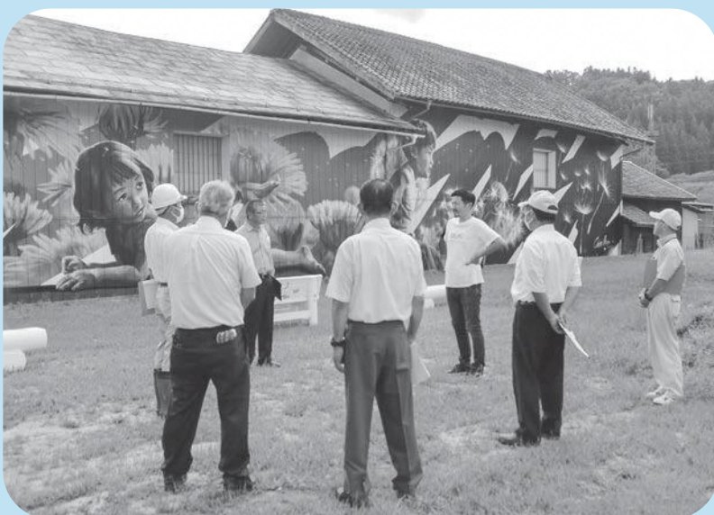
絵画の制作活動について説明を受ける議員

産業建設常任委員会は町を芸術(アート)で盛り上げる「フルドノ アート ディステラリクト」の絵画等を視察しました。現地視察後、視察箇所について意見交換をしました。