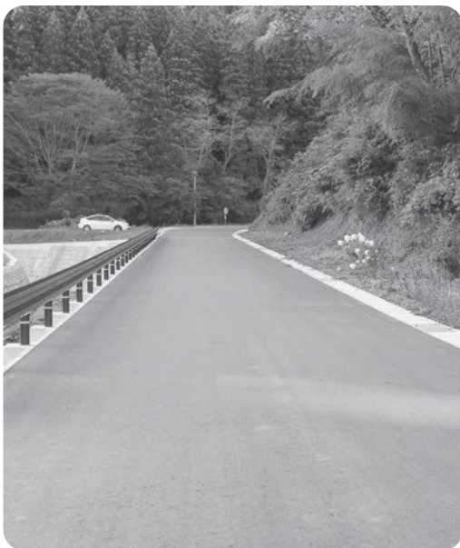
改良が進む町道越代熊倉線