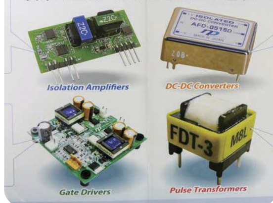
工場で作られる製品