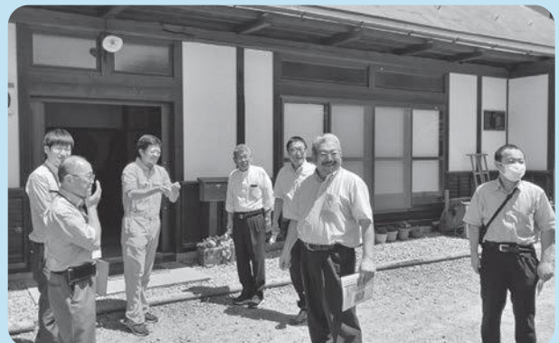
小澤さんから説明を受ける防府市議会議員