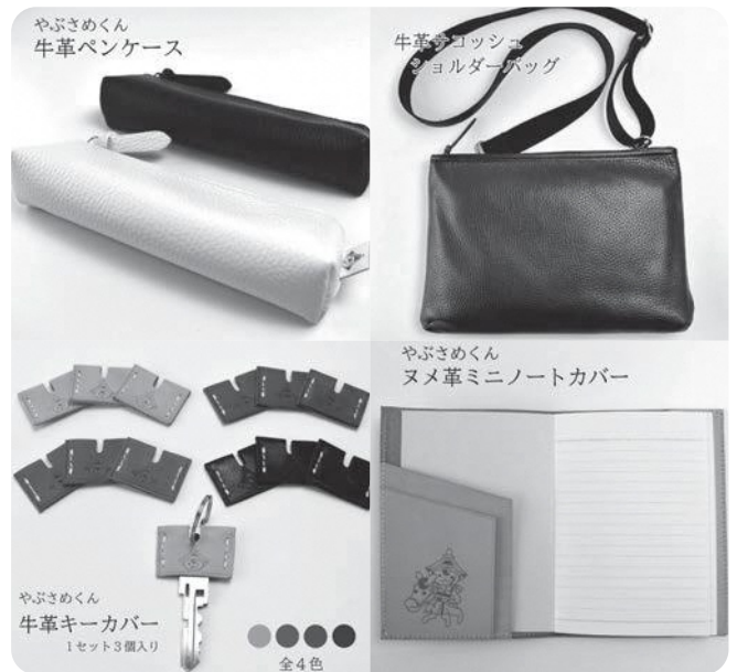
新たに追加された革製品

町長 これまでの返礼品に加え町内事業所で生産している革製品を追加します。また、品数や内容の充実が重要であることから見直しに努めます。