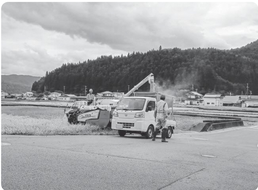
コンバインでの稲刈り

町長と議会議員は二元代表制であります。議会は決定した政策がすべて適法、適正、公平、効率的、民主的になされているかを住民の立場にたつて監視することが求められています。令和5年度当初予算に農業機械等導入支援補助金事業で1470万円が計上されました。この補助金は、農地を守るために担い手の農業機械導入に対して補助する目的であり、問題はありません。しかし内容を問うたところ、内容に不備な点があると議会から指摘され、予算執行は保留となり、再度検討して議会に説明するよう求められました。