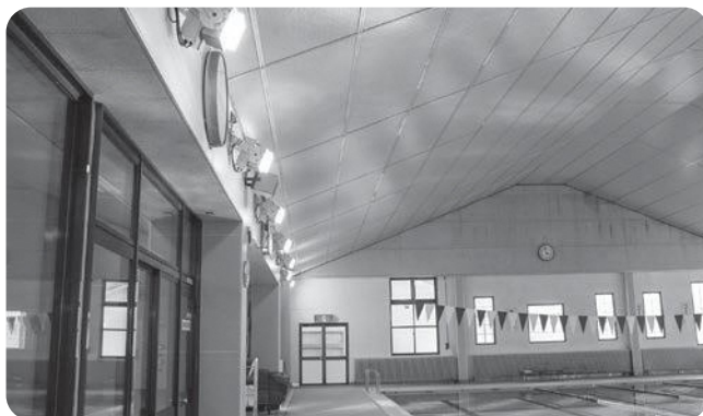
中学校体育館・町民水泳プールLED化 2,912万8,000円