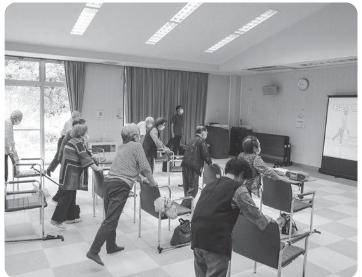
楽しく運動習慣を身につける和楽居処 わらいどころ