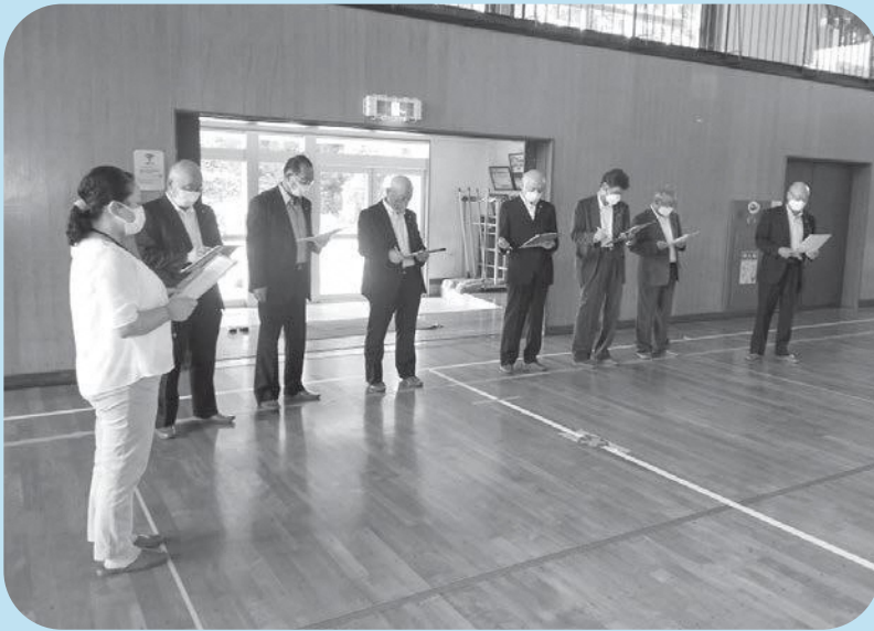
古殿中体育館のLED化について説明を受ける議員

総務常任委員会は古殿中学校体育館照明設備取替工事や健康管理センター運動室器具類、ふるどのクリニック空調設備改修工事などを視察しました。現地視察後、視察箇所について意見交換をしました。