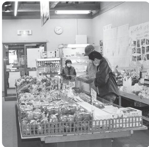
再開発が進められる予定の道の駅

道の駅再開発は喫緊の課題として取り組まれていますが、用地取得の交渉はどうか進展しているか。