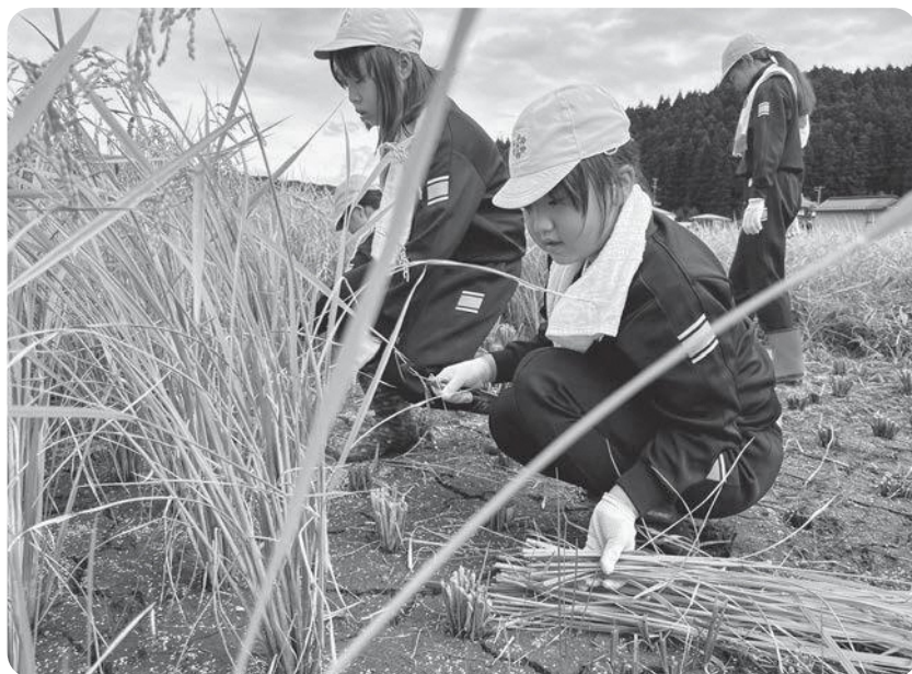
次世代につながる農業

町長 該当者は14件となっており、8月23日にその該当者へ事業の説明会を実施し、今年度は5件の支援が決定しました。 木戸 要綱の内容で、その後変更した点はあるか。 町長 特にありません。