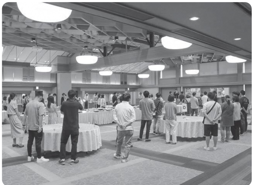
多くの町民が参加した石川コン

常盤 石川コンにおける町内参加者の実績は。 町長 平成26年度から実施しており、現在まで15回開催されておりまして、延べ197人が参加し、5組の方が結婚に至っております。 常盤 実績を踏まえて今後の行政の方針は。 町長 引き続き、出会いの場を提供してまいりますと考えております。