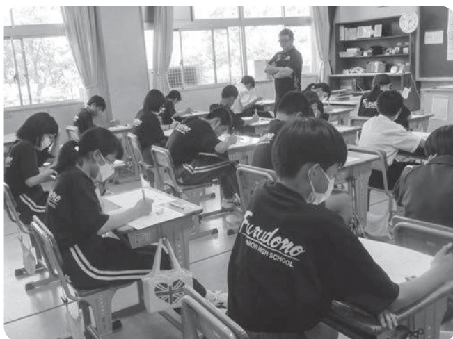
テストに取り組む中学生