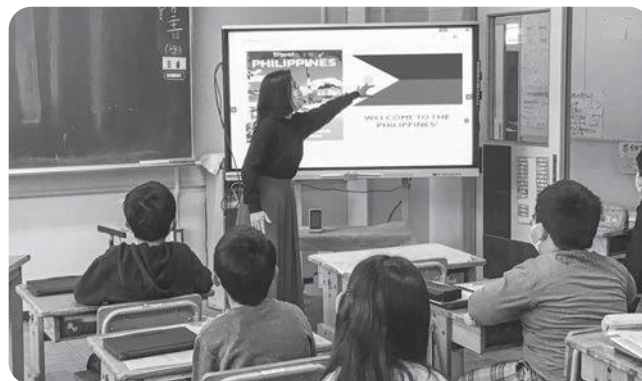
電子黒板の購入(小学校・中学校) 1,397万円