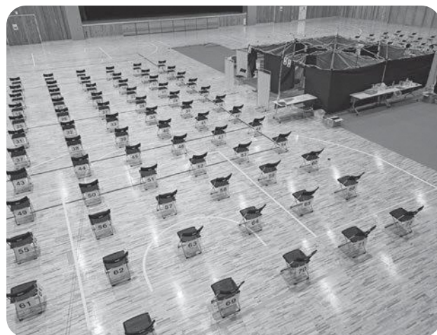
10月1日に実施された集団接種の会場

入所施設では新規受け入れ停止で収束を図り、通所施設は陽性者の利用を停止し、感染拡大防止に努めます。