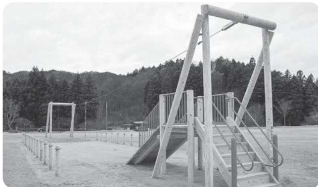
憩いの森公園木製遊具 695万2,000円