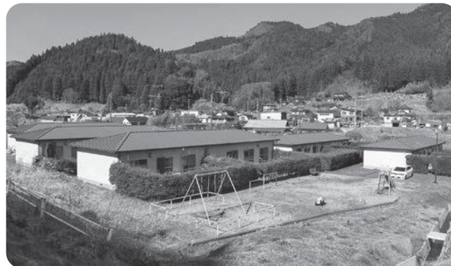
西渡団地建替基本計画策定 161万400円