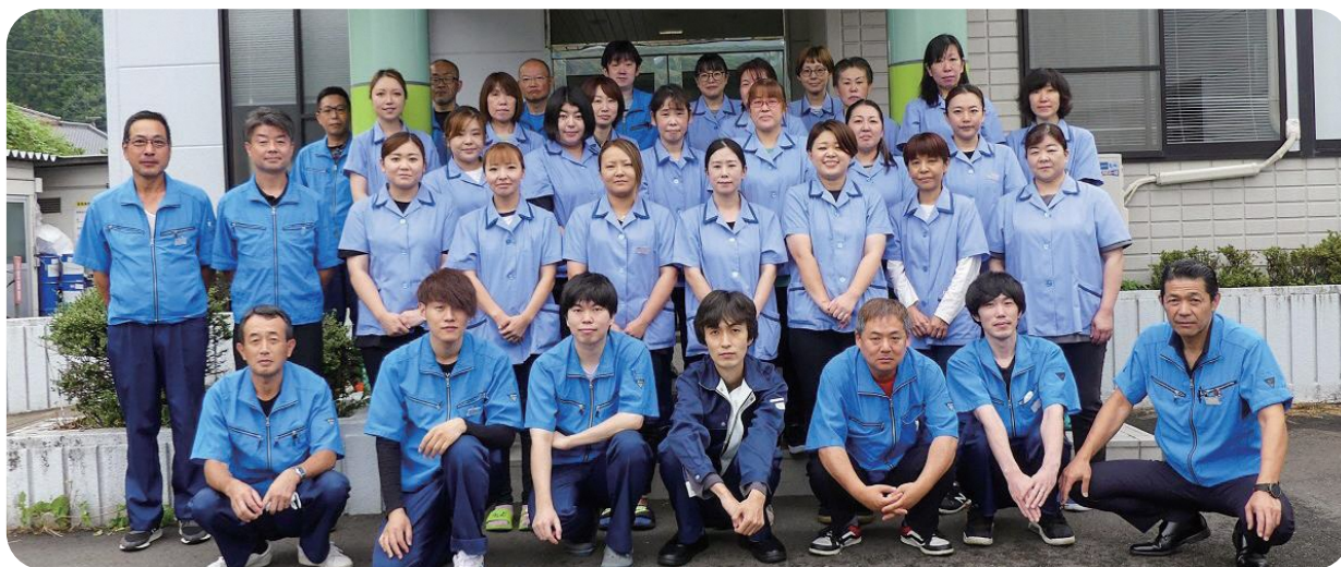
日本パルス工業（株）の皆さん