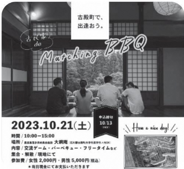
町で開催する古殿コンの案内

町長 サポーターの役割は、未婚者の方からの相談、婚活イベントの周知と協力、結婚記念品の申請などを担っていますので、サポーターにより結婚に至った実績については把握しておりません。