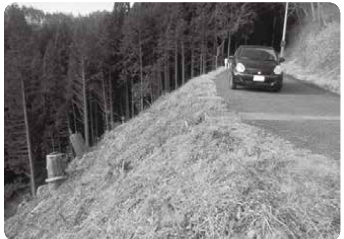
ガードレールが必要と思われる町道（上松川地内）

町長 当該信号機については、平成30年12月22日に起きた死亡事故により破損し、その復旧等の対応は、石川警察署が行っております。