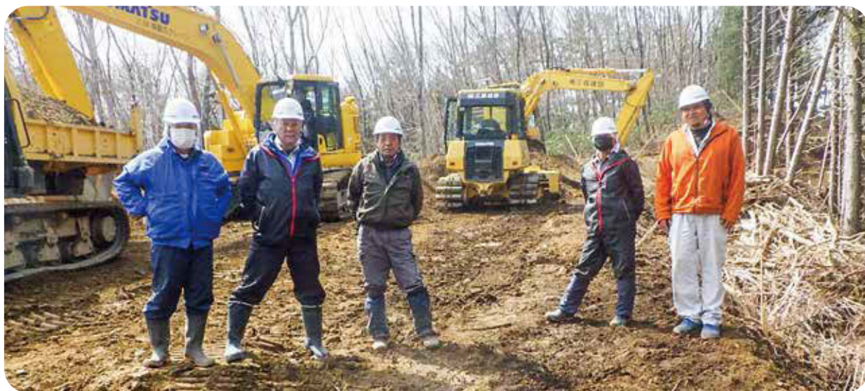
三森建設の社員の皆さん

「信頼あるもの造り」をモットーに、古殿町を中心に近隣市町村で土木工事を行っております。現在は砂防施設や道路工事などに従事しております。社員1人1人が思いやる行動を行い、安全作業を第一としてお客様のニーズに応えられるよう努力しております。