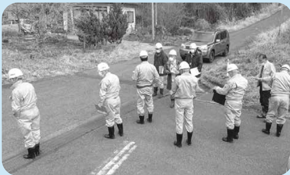
町道山口下鵬巣線を現地確認する委員

総務常任委員会は町道山口下鵬巣線や町道小松川須巻線、町道上町千足線などの道路維持補修事業等を視察しました。現地視察後、視察箇所について意見交換をしました。また、付託された請願1件を採択としました。