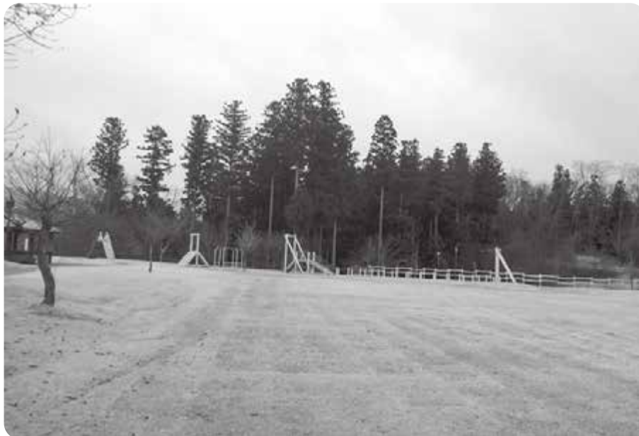
間伐作業が発注されている山林