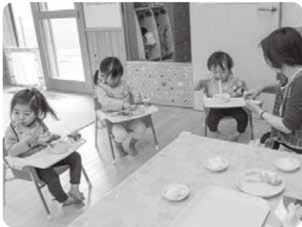
こども園の給食の様子