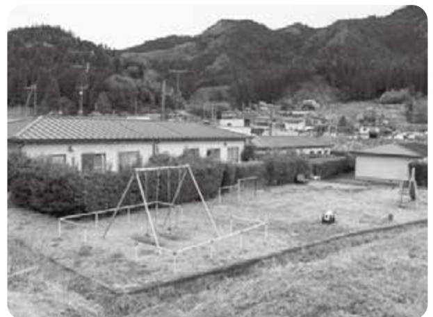
建替計画のある西渡団地

町長 専門的知識、他の自治体の取組内容の情報を持つ受託業者の力を借りながら、実態調査に取り組みます。