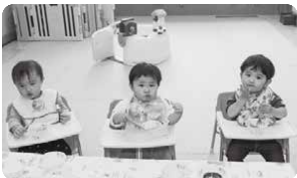
業務委託される予定のこども園の給食