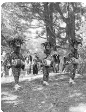
存続が困難になっている論田の獅子舞

町長 流鏝馬・笠懸は流鏝馬保存会に対し以前から支援しており、今後状況を見守り、無形文化財と併せて支援していきます。存続が危ぶまれている祭事もあり、地域と協議しながら解決策を探りたいと思います。