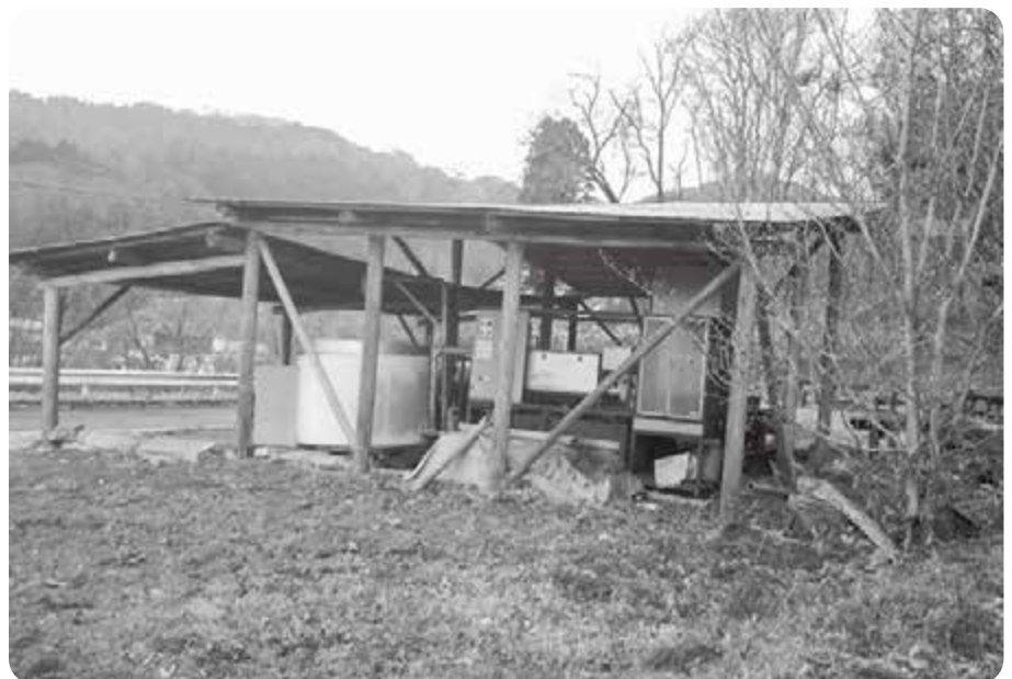
撤去される予定の炭窯

町長 職員が定期的に確認しております。里山広場については、来年度予算において、敷砂利の実施と、広場内にある炭窯の撤去を予定しております。