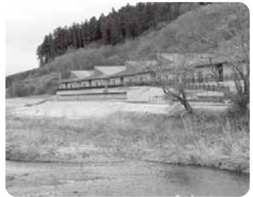
増床が困難なふるどの荘

町長 町が直接相談を受けた場合は町内施設を紹介し、施設への相談、申込みを行うようお願いしております。