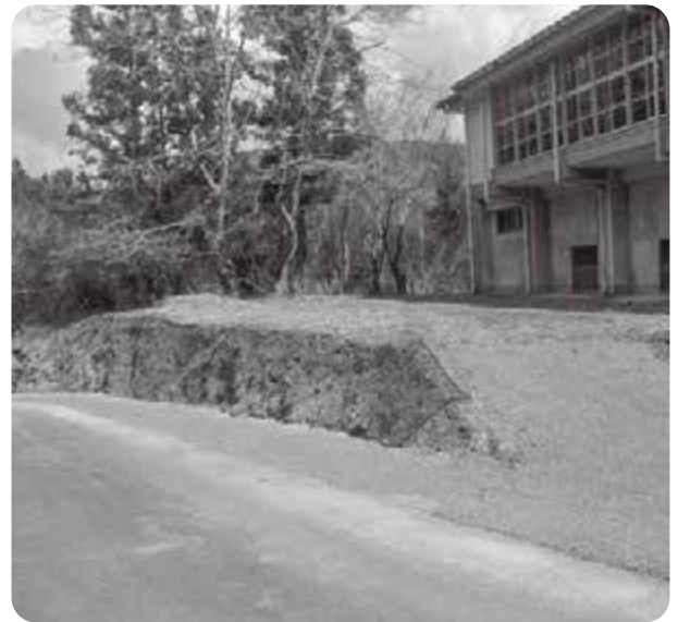
拡幅された中学校体育館裏の道路

町長 財源確保の面では、大変貴重な財源として認識しており、今後も自主財源の確保に努めてまいります。