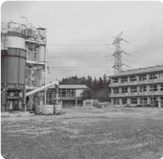
利活用が進む旧論田小学校の敷地内