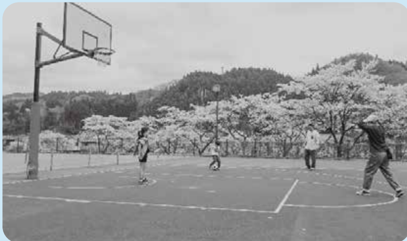
新生活に助成がされます

○住宅取得費用 ○住宅賃借費用 ○引っ越し費用 ○住居のリフォーム費用 30万円が上限ですが、令和5年度より夫婦ともに29歳以下の場合には60万円が上限となります。