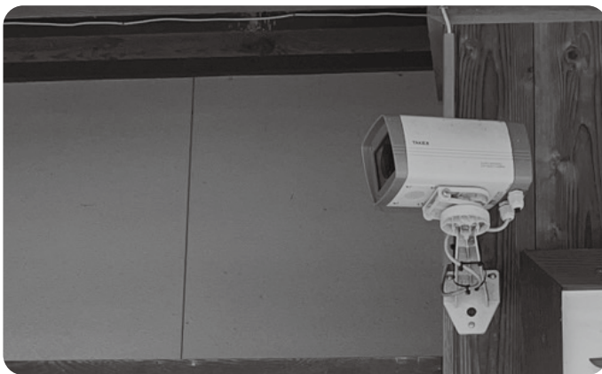
犯罪防止に有効な防犯カメラ

松崎 公共施設防犯カメラ設置事業を民間も対象として、カメラ設置を励行してはどうか。