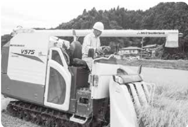
稲刈り作業中のコンバイン

藁谷 農家の基礎的資材である肥料価格、農業用資材や燃料などの価格が高騰し、さらに農業機械も価格が値上げの傾向が進んでおります。長年にわたり使用してきた農業機械であるトラクター、田植機、管理機などは古くなり故障し、更新しようにも更新ができません。耕作放棄地の鈍化、畑の維持、農家支援の農業機械譲渡を仲介する仕組み事業を検討すべきだと思います。 町長 農事実行組合の加入戸数では、令和4年4月現在で36戸です。