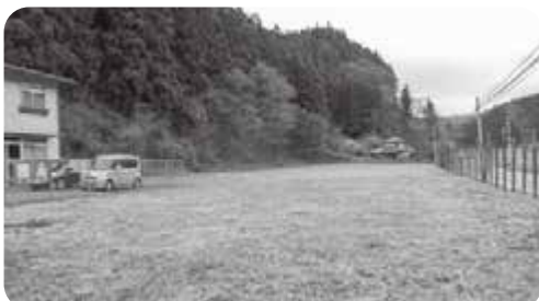
西渡団地が移転される予定の前木地内

町長 障がい分野での助成制度を整備しています。 岡部 道の駅拡張計画は。 町長 用地取得の合意が得られた場合は「土地開発基金」を活用し購入することを考えております。