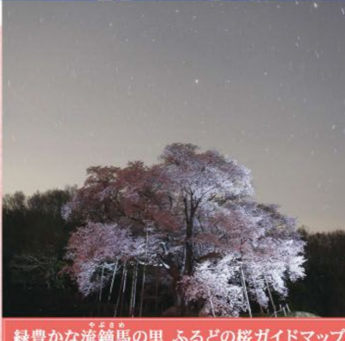
緑豊かな流鏝馬の里 ふるどの桜ガイドマップ